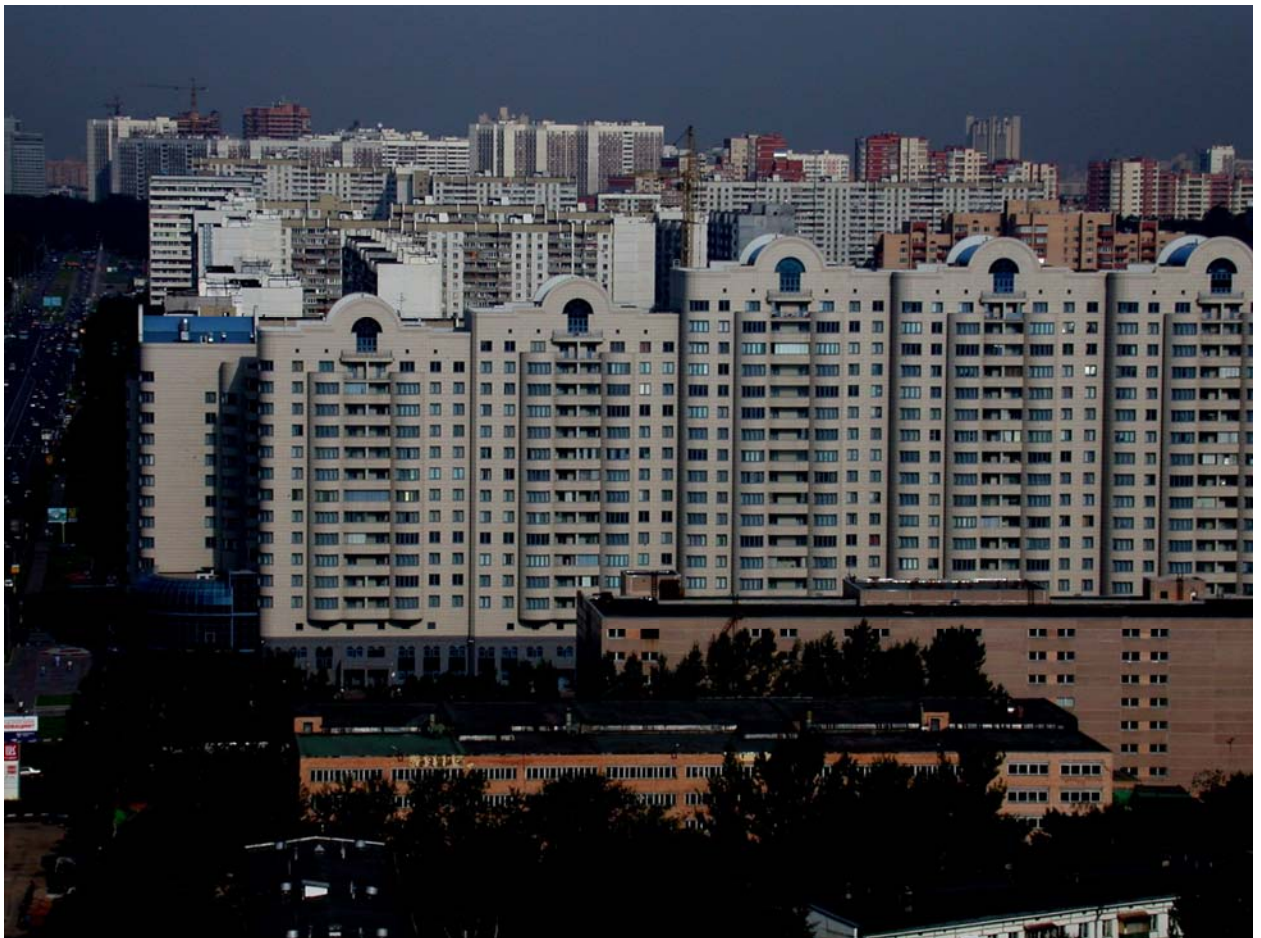
Рис. 1. Пример организации жилого района.

На рисунке 1 изображена застройка современного жилого микрорайона. Она представлена многоэтажными жилыми домами (14 – 22 этажа). Рассматриваемый пример является прекрасной иллюстрацией массовой застройки, которая приобретает актуальность в условиях современных мегаполисов.