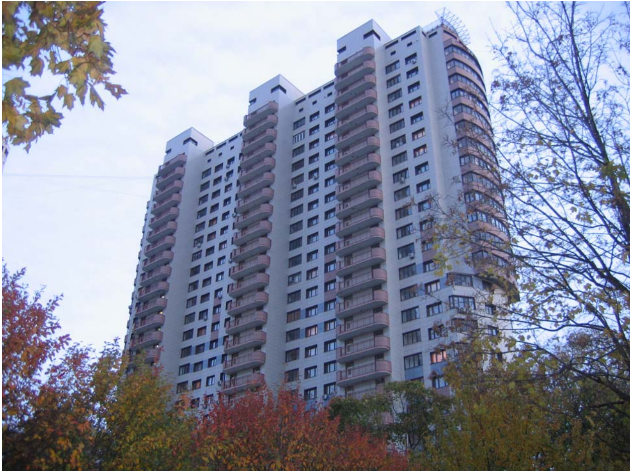
Рис. 3. Многоквартирное жилое здание

индустриальности строительства, в том числе уменьшением срока возведения здания. На рисунке 3 представлено современное жилое здание, характеризующее основные тенденции жилой застройки.