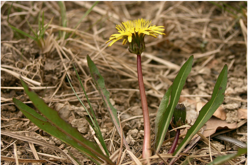
Abb. 11: Habitus von Taraxacum bavaricum , Uferzone des Hintersees. — Fig. 11: Habitus of Taraxacum bavaricum , shore of lake Hintersee.

Neu für Salzburg. Taraxacum madidum ist durch eine V-förmige Hülle, schmale, eng anliegende und lanzettliche äußere Hüllblätter sowie verlängerte Blattendlapfen charakterisiert (KIRSCHNER & ŠTĚPÁNEK 1998; UHLEMANN & al. 2005). Aus Österreich war die Art bislang nur aus den Nördlichen Kalkalpen Nordtirols (v. a. KIRSCHNER & ŠTĚPÁNEK 1998; SCHMID 2003) und Oberösterreichs (Diewald in