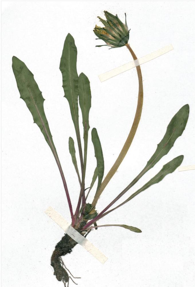
Abb. 12: Taraxacum turfosum vom Bluntauental aus dem Hb. Pilsl Nr. 19431. — Fig. 12: Taraxacum turfosum from Bluntauental, Hb. Pilsl Nr. 19431.

I. Uhlemann; – T e n n e n g a u : Weitenau SW Gehöft Kronreif, Feuchtwiese in Bachnähe, ca. 765 msm, 8345/4, 8. 6. 2010, leg./det. O. Stöhr; – T e n n e n g a u : Dachstein-West, Riedelkaralm, Niedermoor, ca. 1440 msm, 8446/4, 12. 6. 2010, leg./det. O. Stöhr; – P o n g a u : Radstädter Tauern, Marbachtal NW vom Rasthaus Tauernalm, ca. 300 m SSE der Schützbachalm, Weiderasen mit Feuchtstellen, Kalk, 1110 msm, 8746/1, 4. 6. 2010, leg. H. Wittmann, det. O. Stöhr & P. Pilsl (SZB); – P i n z g a u : Schidergraben NW Weißbach bei Lofer, vorderer Talbereich nahe den Naturbadeplätzen, Wegrand, ca. 675 msm, 8442/3, 25. 5. 2010, leg./det. O. Stöhr; – P i n z g a u : Niedersnill, etwa 600 m NW des Badesees Niedersnill, Niedermoor, 8741/2, 1. 6. 2002, leg. C. Eichberger & M. Sigl, det. O. Stöhr & P. Pilsl (SZU); – P i n z g a u : Hohe Tauern, Ferleital, Rotmoos, Kalkniedermoor bei der Kälberetzhütte, ca. 1275 msm, 8842/4, 4. 6. 2010, leg./det. O. Stöhr; – P i n z g a u : Hohe Tauern, S Rauris, Hüttwinkeltal S Bodenhaus, Nieder-