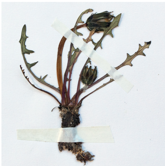
Abb. 10: Taraxacum ancoriferum aus Fuschl aus dem Hb. Stöhr Nr. 6591. — Fig. 10: Taraxacum ancoriferum from Fuschl, Hb. Stöhr Nr. 6591.

SW Hundsmarkt, Uferstreuwiese, ca. 670 msm, 8145/4, 3.5.2008, leg. O. Stöhr, det. I. Uhlemann; – F l a c h g a u : Thalgau, Hundsmarkt NE Fuschlsee, beim Fußballplatz im NSG Fuschlsee, wechselfeuchte Viehweide, ca. 670 msm, 8145/4, 3.5.2008, leg. O. Stöhr, det. I. Uhlemann; – F l a c h g a u : Faistenau, nördliche Uferzone des Hintersees, lückige, kurzrasige, wechselfeuchte Ufergrasrasen, ca. 690 msm, 8245/1, 3.5.2008, leg. O. Stöhr, det. I. Uhlemann.