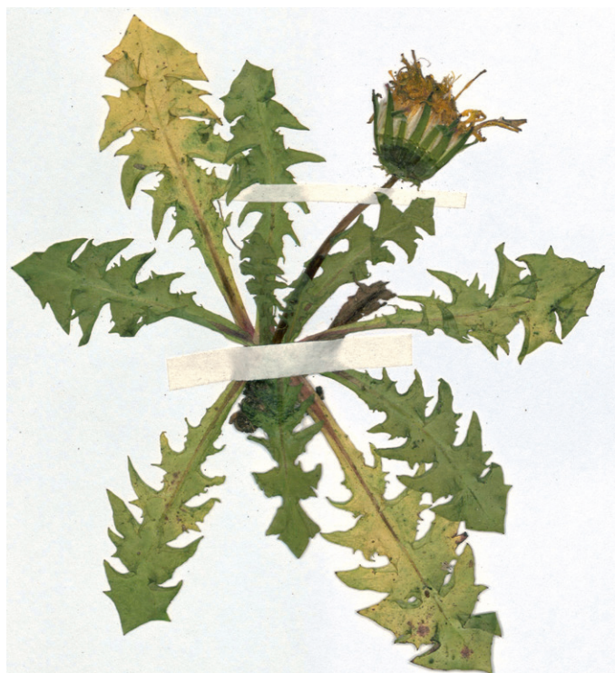
Abb. 2: Taraxacum obtusiense vom Kraxenkogel in den Radstädter Tauern aus dem Hb. Pilsl Nr. 23101. — Fig. 2: Taraxacum obtusiense from Kraxenkogel, Radstädter Tauern, Hb. Pilsl Nr. 23101.

Aus Salzburg ist diese Art bereits mehrfach dokumentiert, nachfolgend dazu die drei relevanten Literaturstellen: SOEST (1959): Mallnitzer Tauern, 2300 msm, 1904, leg. Dolenz (GZU); – SAHLIN & LIPPERT (1983) sowie LIPPERT & al. (1997): Tennengau, Hochgöll, 7500', 1846, Einsele (M); – POLATSCHKE (1999): Pinzgau, Geißstein. Neuere