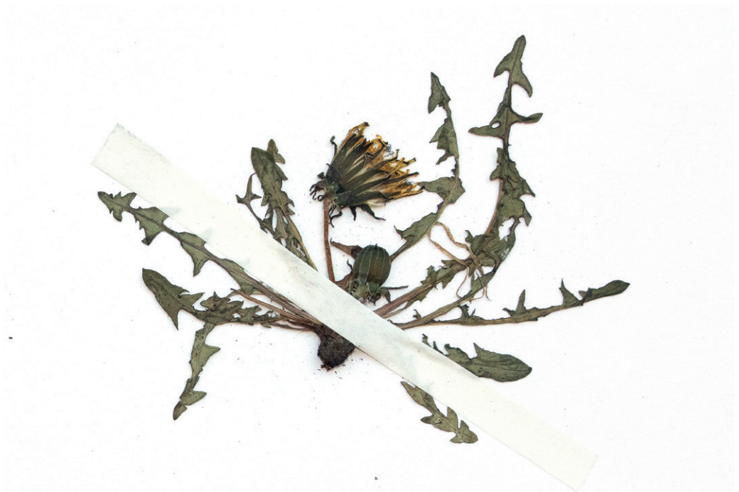
Abb. 8: Taraxacum plumbeum aus Rauris aus dem Hb. Stöhr Nr. 7527. — Fig. 8: Taraxacum plumbeum from Rauris, Hb. Stöhr Nr. 7527.

Neu für Salzburg. Die Bestimmung des im Raurisertal aufgesammelten und zunächst unter der sect. Taraxacum abgelegten Materials führt mit dem Schlüssel von UHLEMANN & al. (2005) recht zwanglos zu dieser Art, welche durch folgende Merkmale charakterisiert ist: Pflanze sehr zierlich und niederwüchsig, Blätter behaart, Seitenloben ± ungezähnt und zurückgebogen, Blüten mit Pollen (Pollenkörner aber ungleich groß), Griffel graugrün, innere Hüllblätter mittelgrün, äußere an der Spitze mit dunklen Schwielen (Abb. 8). Nach DOLL (1974) ist diese Art in Europa weit verbreitet und auch schon von Österreich bekannt (vgl. auch VAŠUT 2003 und FISCHER & al. 2008), wie