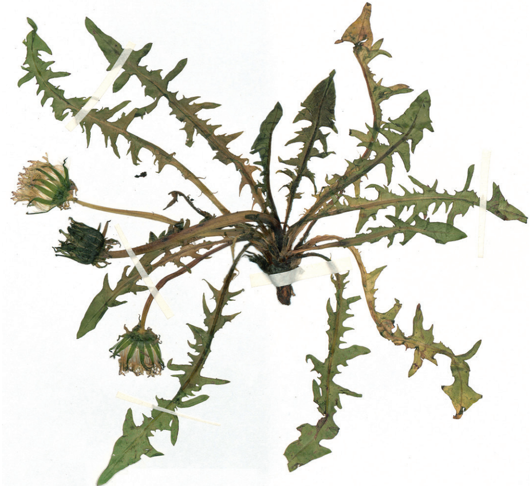
Abb. 7: Taraxacum tirolense vom Krimmler Achenal aus dem Hb. Pilsl Nr. 23470. — Fig. 7: Taraxacum tirolense from Krimmler Achenal, Hb. Pilsl Nr. 23470.

In der floristischen Literatur über Salzburg sind lediglich folgende Angaben für Taraxacum laevigatum agg., nicht jedoch Nachweise für Arten der heutigen sect. Erythrosperma zu finden: HANDEL-MAZZETTI (1907): Salzburg, leg. A. Braun (Beleg in B); SAUTER (1863): Feldraine bei Leogang und Maria Alm (vgl. auch SAUTER 1879 sub Taraxacum taraxacoides ); SCHWAIGHOFER (1951): Kleinarltal, Achenrain zwischen Stadlerhaus und Botenwirtsbrücke und Schwabmühlbachl; VIERHAPPER (1935): Trockenwiesen in Muhr und Straßenrand in Schellgaden im Murwinkel. Die Angaben von VIERHAPPER (1935) und jene bei Leogang von SAUTER (1863) wurden von WITTMANN & al. (1987) im Salzburger Verbreitungsatlas quadrantiert, zusätzliche Funde sind dort nicht angeführt. Die