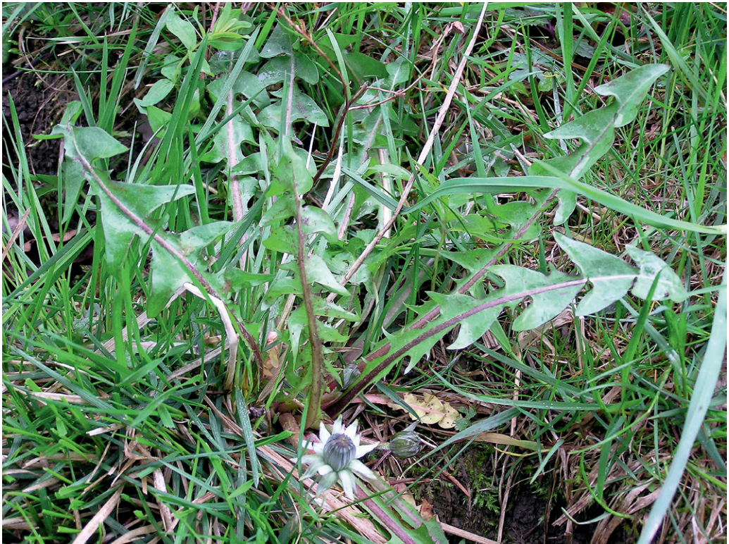
Abb. 9: Habitus von Taraxacum sect. Hamata , Zistelalm, Gaisberg bei Salzburg. — Fig. 9: Habitus of Taraxacum sect. Hamata , Zistelalm, Gaisberg near Salzburg.

Für das Bundesland Salzburg ist diese durch ziemlich kleine Körbe mit orangen Blüten gut kenntliche Art bislang wie folgt bekannt: FÜRNKRANZ (1960 & 1965): oberes Habachtal, Einzelpflanze, leg. D. Fürnkranz; – SCHNEEWEISS & al. (2003): Hackbrettl, 2250–2500 msm, 8841/2, 2002, leg. G. Schneeweiß; Siebenspitz – Kirchleitenkogel – Schusterkopf, Schutthalden, 2100–2419 msm, 8844/1, 1999, leg. A. Tribsch & M. Staudinger; – STÖHR & al. (2007): Pinzgau, Hohe Tauern, Goldberggruppe, Plattenkar E Hochtör und W Modereck, Polsterfluren und Rasenfragmente über Karbonat im Gratbereich W Weißenbachscharte, ca. 2630 msm, 8943/1, 26. 7. 2006, leg./det. O. Stöhr (Hb. Stöhr); – STÖHR & al. (2009): [Pinzgau], montes Hohe Tauern, Glocknergruppe, [Talschluss des Seidlwinkeltales], ad viam notatum n. 702 ex loco „Hochthor“ (2504 msm) versus dorsum Bretterspitzen, ohne Habitat- und Seehöhenangabe, [8942/2], 29. 7. 1994, leg./det. V. Žíla, Hb. LI (317010, 317011). Noch zu überprüfen ist die folgende in der Datenbank der Floristischen Kartierung hinterlegte Geländebeobachtung: Pinzgau, NW-Hang des Hackbrettl – Reichenbergkar, 2250–2500 msm, 8841/2, 30. 8. 2002,