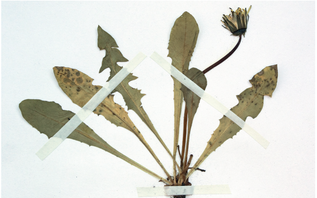
Abb. 3: Taraxacum saasense von Obertauern aus dem Hb. Stöhr Nr. 7470. — Fig. 3: Taraxacum saasense from Obertauern, Hb. Stöhr Nr. 7470.

Pinzgau: Fuschertal, Schneeboden bei der Fuscherlacke, 8842/4, 29.8.1972, leg. H. Wagner, det. O. Stöhr & P. Pilsl (SZU); – Pinzgau: Uttendorf, Stubachtal, Übelkar, Silikatschuttflur, ca. 2280 msm, 8841/4, 9.7.2007, leg. O. Stöhr, det. I. Uhlemann; – Pinzgau: Hohe Tauern, Felbertal, Weg von der St. Pöltener Hütte (= Felbertauernpass) auf den Tauernkogel, Silikatschutt, ca. 2800 msm, 8840/2, 17.8.2004, 12°29'24" E 47°09'24" N, leg./det. P. Pilsl; – Pinzgau: Raurisertal, Vorfeld des Goldbergkees, Geröll, 2202 msm, 8943/2, 27.7.2008, leg. W. Diewald, det. I. Uhlemann (Hb. W. Diewald); – Lungau: Hafnergruppe, Murwinkel, Vorderer Schober, Schrovinkar, von Felsblöcken durchsetzte alpine Rasen am Schrovimbach, ca. 2000 msm, 8846/3, 26.7.2009, 13°24'24" E 47°06'56" N, leg. P. Pilsl, det. O. Stöhr.