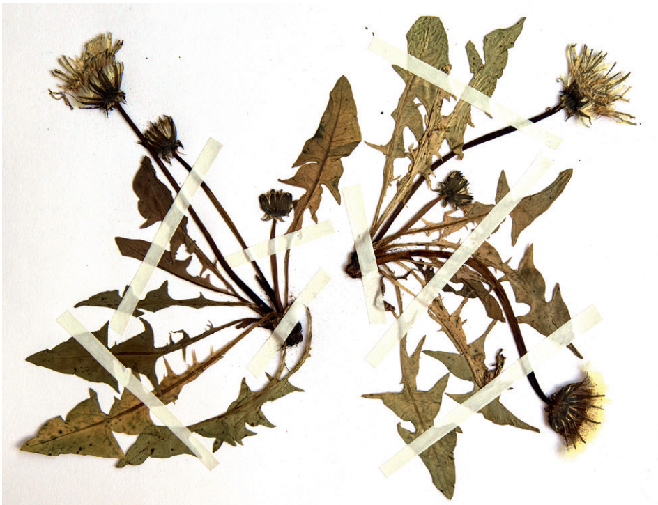
Abb. 1: Taraxacum martellense vom Trattberg aus dem Hb. Stöhr Nr. 6932. — Fig. 1: Taraxacum martellense from Trattberg, Hb. Stöhr Nr. 6932.

Allein NEUMANN & POLATSCHKE (1974) und POLATSCHKE (1999) geben diese Art für das Bundesland Salzburg an, liefern aber keine genauere Fundangabe. Im angrenzenden