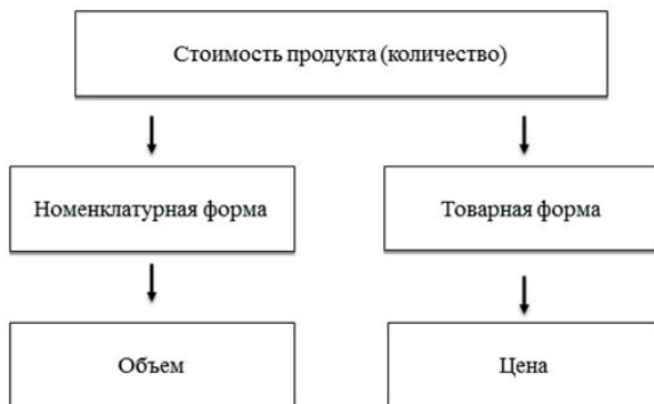
Рис. 4. Объемное и ценовое определения стоимости

Товар – это отдельный, единичный продукт. Значит, товарная форма стоимости, это стоимость отдельного продукта. На практике она получила определение цены (Рис. 4).