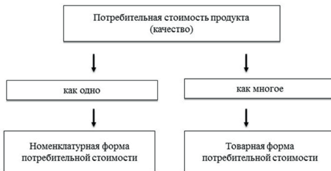
Рис. 2. Формы потребительной стоимости продукта