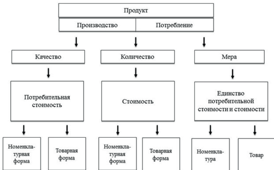
Рис. 5. Система определения продукта на ступени бытия

стоимости – только в товарной. Рассматриваемое простейшее различие товарной формы потребительной стоимости и стоимости, развившись до противоречия в условиях разделения труда, даст нам становление, расцвет и снятие капитала. Товар превратится в капитал.