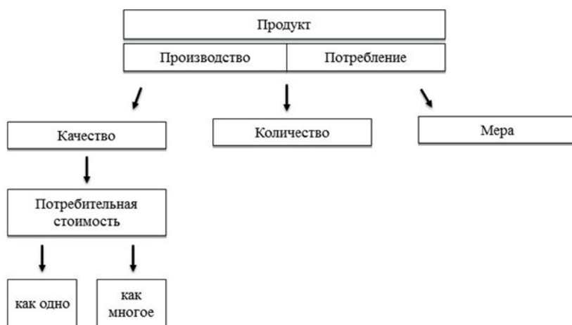
Рис. 1. Потребительная стоимость продукта как одно и многое