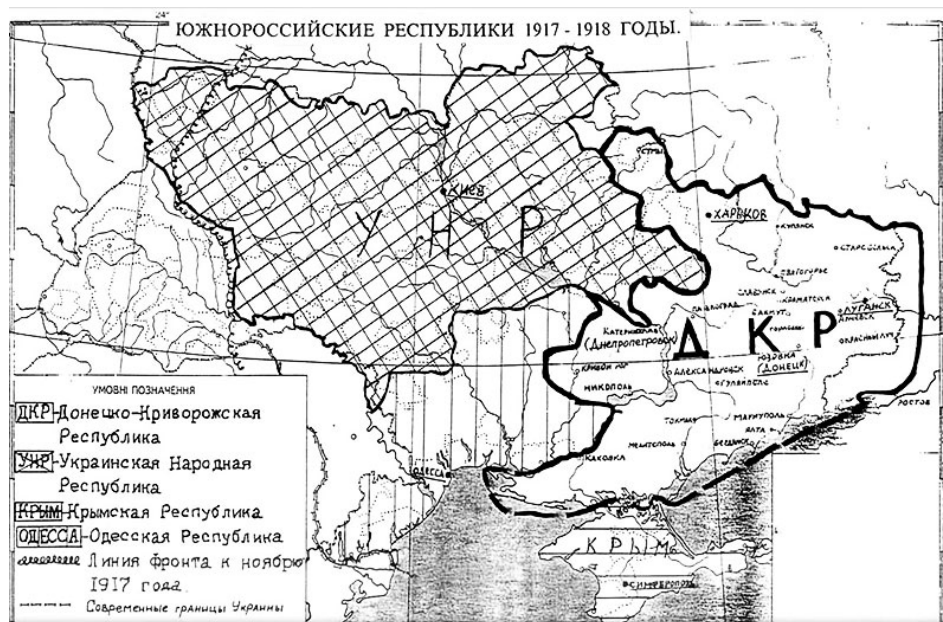
Рисунок 3 - Южнороссийские республики в 1917–1918 гг: Украинская Народная, Донецко-Криворожская и Одесская [28].

В конечном итоге В.И. Ленин 14 марта 1918 года посчитал, что существование вновь созданной республики в составе РСФСР нецелесообразно и окрестил это "вредным капризом" руководства ДКСР [23]. Пленумом ЦК РКП(б) было решено признать Донецкий бассейн частью Украины с перспективой создания единого для всей Украины правительства [19].