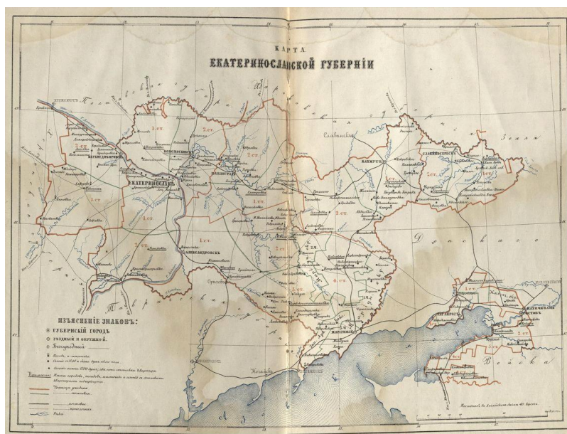
Рисунок 2 – Карта Екатеринославской губернии [29].