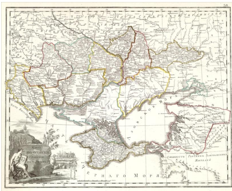
Рисунок 1 – Карта Новороссійской губернии из 12 уездов [24].