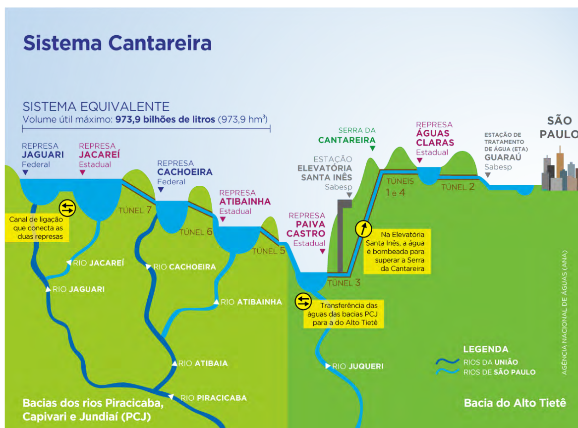
Figura No 1: Representação do Sistema Cantareira

De fato, se a busca de soluções pelo governo do Estado de São Paulo para minimizar os problemas de abastecimento de água para a população foi um grande problema e alvo de críticas, os motivos que levaram à crise de abastecimento também o foram. A crítica dos Ministérios Públicos Federal (MPF) e do Estado de São Paulo (MPE) à gestão do Sistema Cantareira está pautada na falta da tomada de decisão pelos órgãos gestores diante da situação de crise que já se anunciava (Fracalanza; Freire, 2015) em séries históricas das vazões dos reservatórios dos sistemas de abastecimento (MPF e MPE, 2014) e em estudos técnicos, como um realizado pelo Consórcio PCJ em parceria com a Universidade Estadual de Campinas (UNICAMP) em dezembro de 2013, que observava a necessidade de se iniciar um programa de estímulo à racionalização do uso da água, a fim de que o Sistema Cantareira fosse poupado (CONSÓRCIO PCJ, 2013). A Figura No 1 apresenta uma representação do Sistema Cantareira.