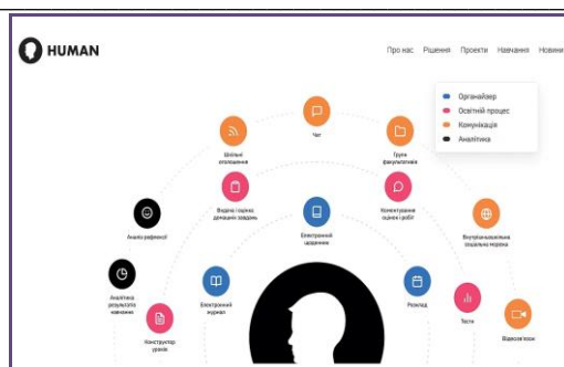
Рис. 1 Функціонал платформи

Етап упровадження дистанційного/віддаленого навчання група вчителів розпочала з пошуку ресурсної бази. Увагу привернула платформа HUMAN Школа та HUMAN Урок (як окрема частина першої) ( https://www.human.ua ). Дві форми організації платформи обумовлені можливістю організувати освітню діяльність як закладу освіти в цілому (HUMAN Школа), так і викладацьку діяльність окремим педагогічним працівником (HUMAN Урок). Це забезпечує реалізацію принципів автономності й академічної свободи для всіх учасників освітнього процесу.