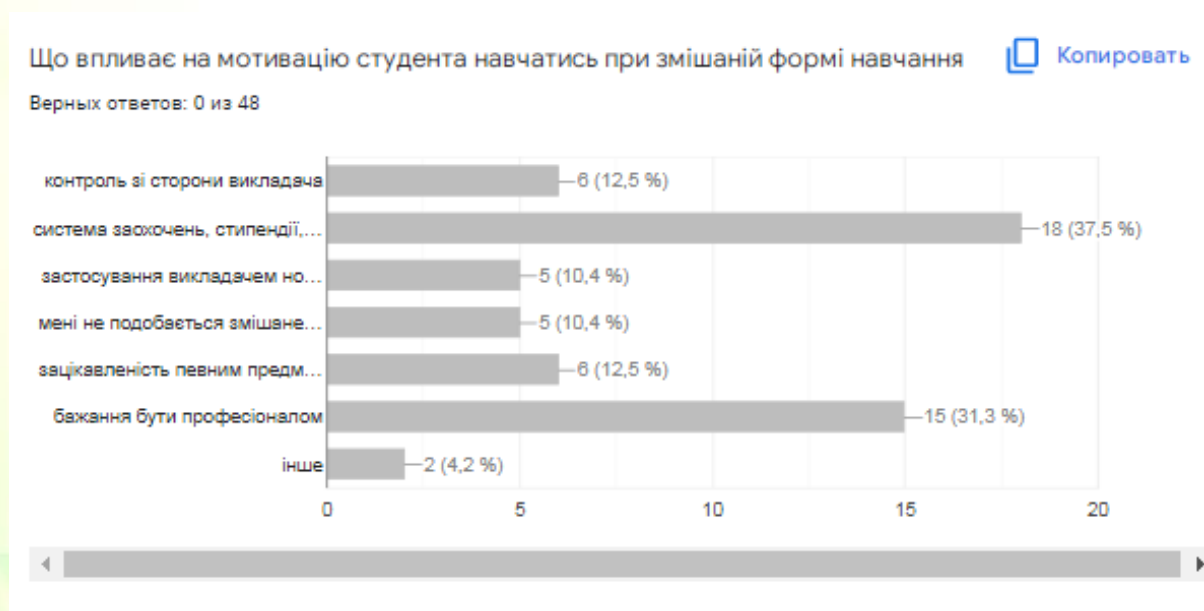
Рис. 2. Аналіз відповідей опитаних студентів

Результати відповідей представлені на рисунку 2. Проаналізувавши, автор відмічає, що для студентів найбільшою мотивацією є система заохочень від адміністрації, наприклад стипендії, але разом з тим, бажання бути професіоналом теж має високе значення для студентів. Але дослідження потребує подальшого аналізу та опитувань студентів та викладачів.