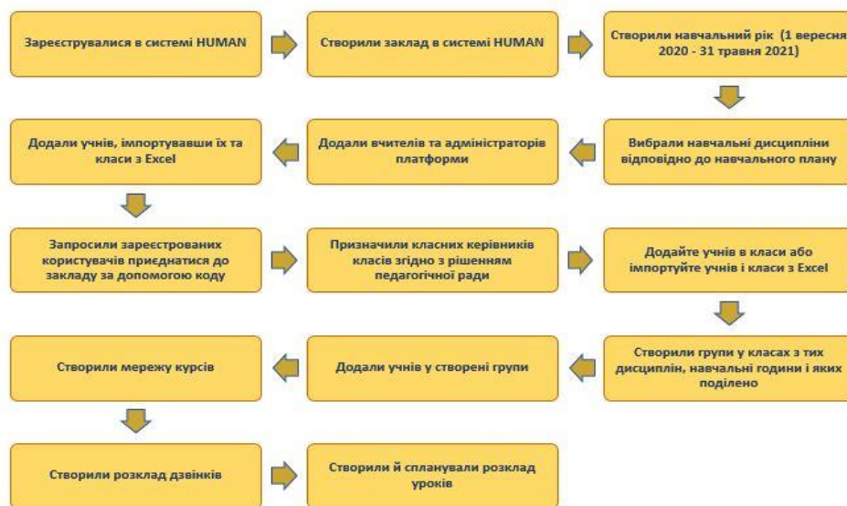
Рис. 3. План упровадження дистанційного навчання в КЗ «Малинівський ліцей № 2»

Зміст подальшої поточної роботи адміністратора полягав у наданні допомоги вчителям щодо наповнення їхніх курсів контентом. З цією метою було проведено 2 тренінги , під час яких учителі на практиці засвоїли роботу на платформі. Творчою групою була розроблена покрокова інструкція «Як розпочати роботу на платформі HUMAN Школа» (рисунок 3), були проведені тренінги, практичні заняття для набуття учителями навичок роботи з платформою. Крім того, розроблені пам'ятки для педагогів та учнів «Як підключитися до платформи HUMAN Школа».