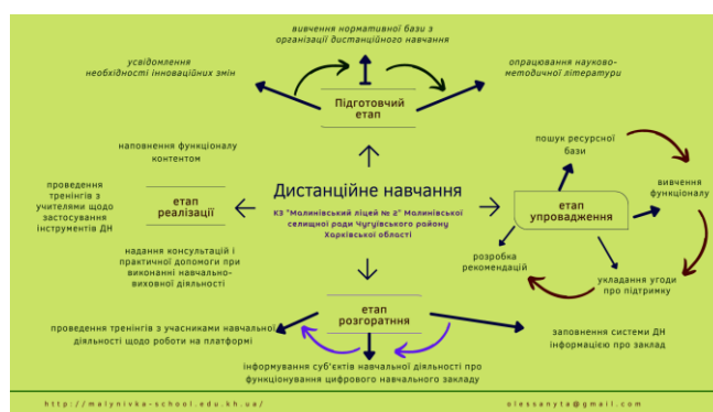
Рис. 2. Алгоритм організації дистанційного навчання

Створення віртуального навчального закладу «Комунальний заклад «Малинівський ліцей № 2» Малинівської селищної ради Чугуївського району Харківської області». Здійснення самої процедури зображено у покроковому плані, розробленому на підставі інструкції з приєднання закладу до платформи (рис. 2).