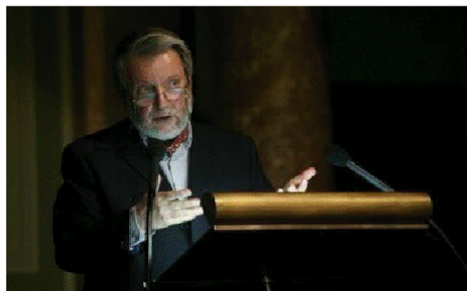
MTA Dísztermében (2010)

Teoretikus szándékaim talán legérdekesebb vonulata esetleg pontosan ez. Egyfelől adott egy szélsőséges formalizmus, a jogé, amit pontosan egy az ember esendő gyakorlatában mint szórt, szétesően kocsonyás, elemeiben erőtlen, dinamikus erő felmutatására csupán tömegessége statisztikai sűrűsödésében képes közegben kíséreltem meg elérhető igazsággént megfogalmazni.