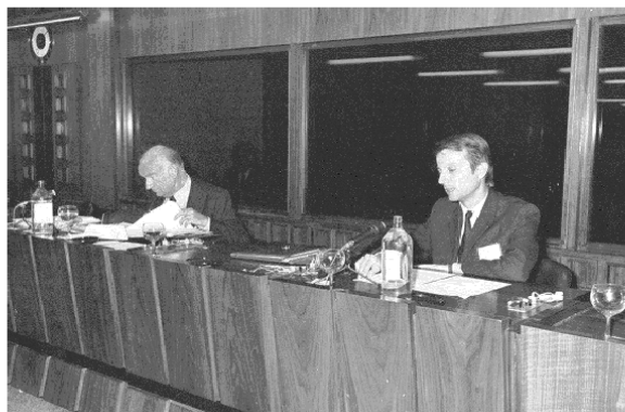
Világkongresszus (Madrid, 1976)

Végül átnőttem egy mindazonáltal szép, mert izgalmasan mozgalmas gyermekkorba, ahol végül is „a kizsákmányoló kizsákmányolása” után két dolog maradt családnak számára: az, hogy magyarok vagyunk, és az, hogy katolikusok vagyunk. Ezt egészítette ki a pécsi iparos öntudat, ami a keresztény erkölcsiséget üzleti tevékenységében rendkívül igényesen művelte, és ahol az üzleti és a családi életet egyaránt átható tisztesség volt bármiféle polgári megbecsülés előfeltétele.