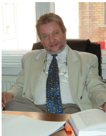
Egyetemi dolgozószobájában (Koltay András fotója, 2005)

Ez magyarázza, hogy a mai napig változatlanul bűnnek kell éreznem azt is, hogy egyre ostobább és egyre doktrinerebb kormányzati oktatási reformok folytán több félév tárgyának kollokviumait egybekapcsoló szigorlat és vele mindennemű szintézis-igény egyszerűen kitagadtatott az egyetemi képzésből. Mintha posztmodernitásunk már arról is elfeledkezett volna, hogy az ember gondolkodó minősége a szintézisalkotó készségnél kezdődik. Ennek fejleszthetése pedig, mint bármiféle minőségi, magasabb szinten történő összegzés egyetlen lehetősége elesett számunkra — az ezt leginkább igénylő, mert a benne rejlő értékeket éppen legteljesebben kibontakoztató tárgy számára — mind a szigorlat műfajának eltörlésével s mind azzal, hogy záróvizsga-lehetőségünket szintén elvesztettük.