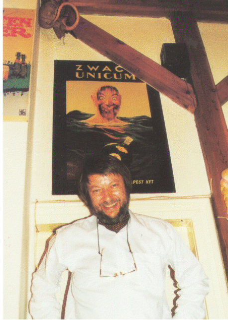
The Poster And Its Model (Mark Van Hoecke fotója, Miskolc, 1997)

változásokat gerjeszt akár szocializmusunkban is — olyat, ami saját logikája szerint s ezért ellenállhatatlanul már-már a szocializmus meghaladását eredményezi. Hiszen ha revolúció a nagy moloch által történt leigáztatásunkkal szemben reménytelen, talán mégis van esély egy számunkra oly fontos, noha kicsiny periférián valamiféle olyan evolúcióra, ami mégis érezhető változásba torkollik.