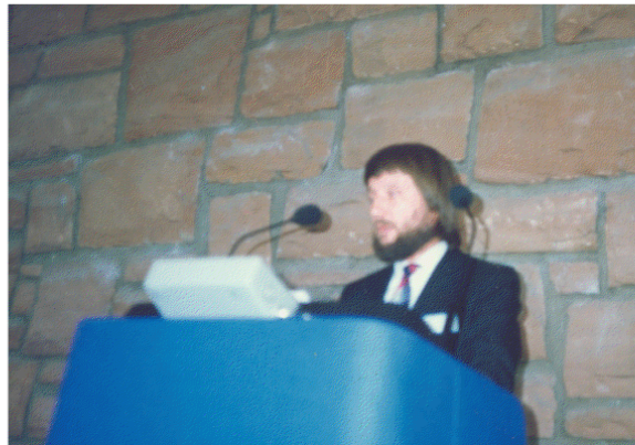
Világkongresszus plenáris előadója (Edinburgh, 1989)