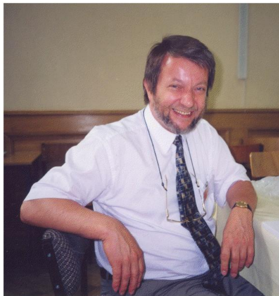
Világkongresszus szünetében (NewYork, 1999)

Példát is említve egy számomra kedves területről, ilyen kísérlet volt az általam nagyon pártfogolt és történetesen művészettörténész, de muzeológiai szakágakban külön képzett fiam szervezésében a Law and Arts , mint olyan stúdium, amely a régészeti kutatások engedélyezésétől a hamisításon csakúgy, mint a műemlékvédelem és tájvédelem összetett problematikáin keresztül a műtárgyablások nemzetközi következményeiig teljes spektrumot adott volna, beleértve olyan mindennapi kérdéseket is, mint a műtárgy-szállítmányozás vagy műtárgy-biztosítás. Ennek megkezdett másfél évének az oktatása során sikerült (talán szakmai életükben először) összehozni mindazon magyar jogászokat, akik rendvédelemtől múzeumokig és mindezek kormányzati igazgatásáig ilyesmikkel — elszigetelten — foglalkoznak. Ilyen tárgyat egész Közép-Európában még ma sem oktatnak. Legközelebb magas fokú művelése kizárólag Londonban történik. (Éltetőjét baráti szalon sikertűlt karunkra invitálnom valamelyik dékánunkkal találkozóra. Együttműködési készsége azonban kiaknázatlan maradt.) Pedig mindent egybevetve katolikus egyházunk a legnagyobb műkincsirtokos hazánkban, s aligha válnék bármely ezzel kapcsolatos ügynek hátrányára egy korszerű tudás. Gondoljuk csak meg, hogy egy felemelkedésre hivatott Magyarország számára mennyire önmaga megtalálásának útja lehet kulturális öröksége gondozásában az optimalitás megtalálása!