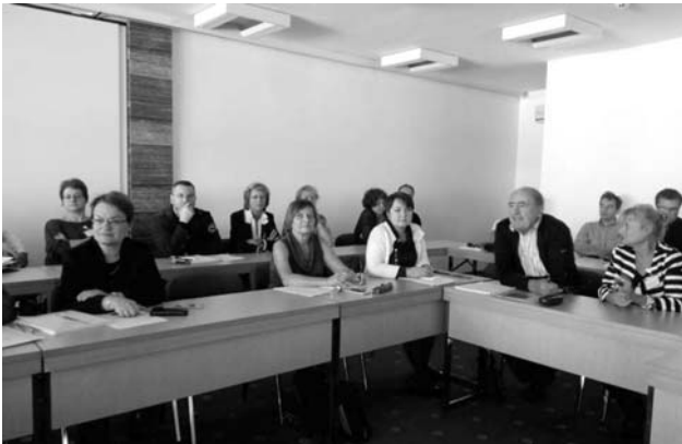
Фото 5. Участь у 25-у ювілейному міжнародному тренінгу для викладачів сімейної медицини

ноєвропейського навчального плану бакалаврату сімейної медицини, післядипломної підготовки фахівців і безперервного професійного розвитку для сімейних лікарів у всіх європейських країнах, створення сильної дослідницької бази, яка є фундаментом для досягнення поставлених цілей.