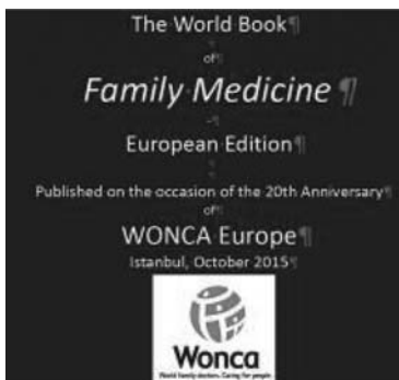
Фото 1. Ювілейна Світова книга з сімейної медицини – Європейське видання

До цієї події була надрукована «Світова книга з сімейної медицини – Європейське видання» під редакцією Carl Steylaerts та Mehmet Ugan . Книга містить 100 нарисів за різними найбільш актуальними темами, які були представлені на конференціях за останні 20 років. Співавторами книги стали 100 представників різних країн світу, 80% яких з Європейського регіону, у