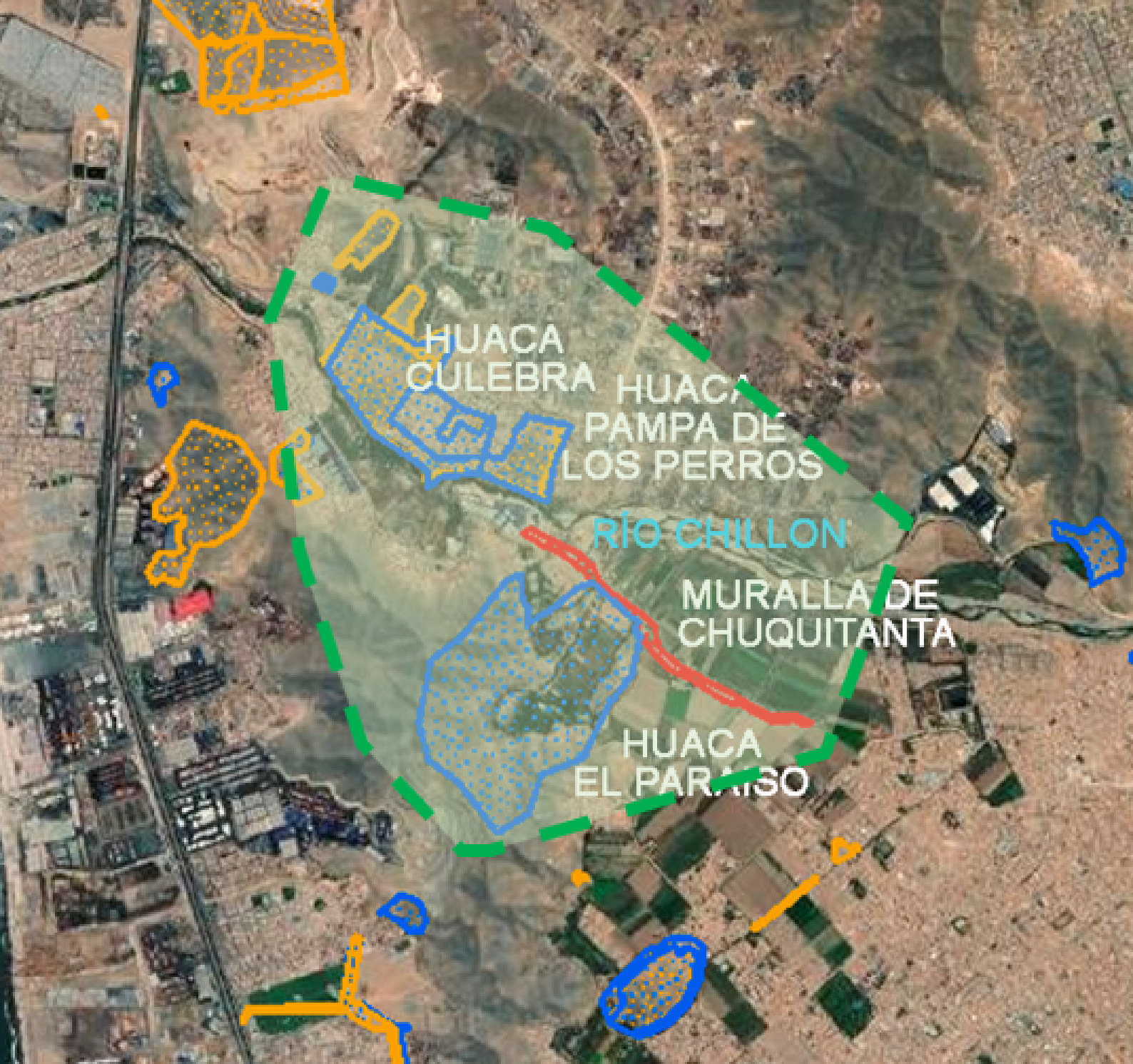
Fig. 1. Zona norte de Lima.

comunidad, con un sentido político; pero el apoderamiento no se consolida, sin la construcción de la estructura que organiza el espacio de la comunidad, el cual está impregnada de una carga cultural, materializando de esta manera en el espacio el concepto de paisaje cultural (Criado, 1991).