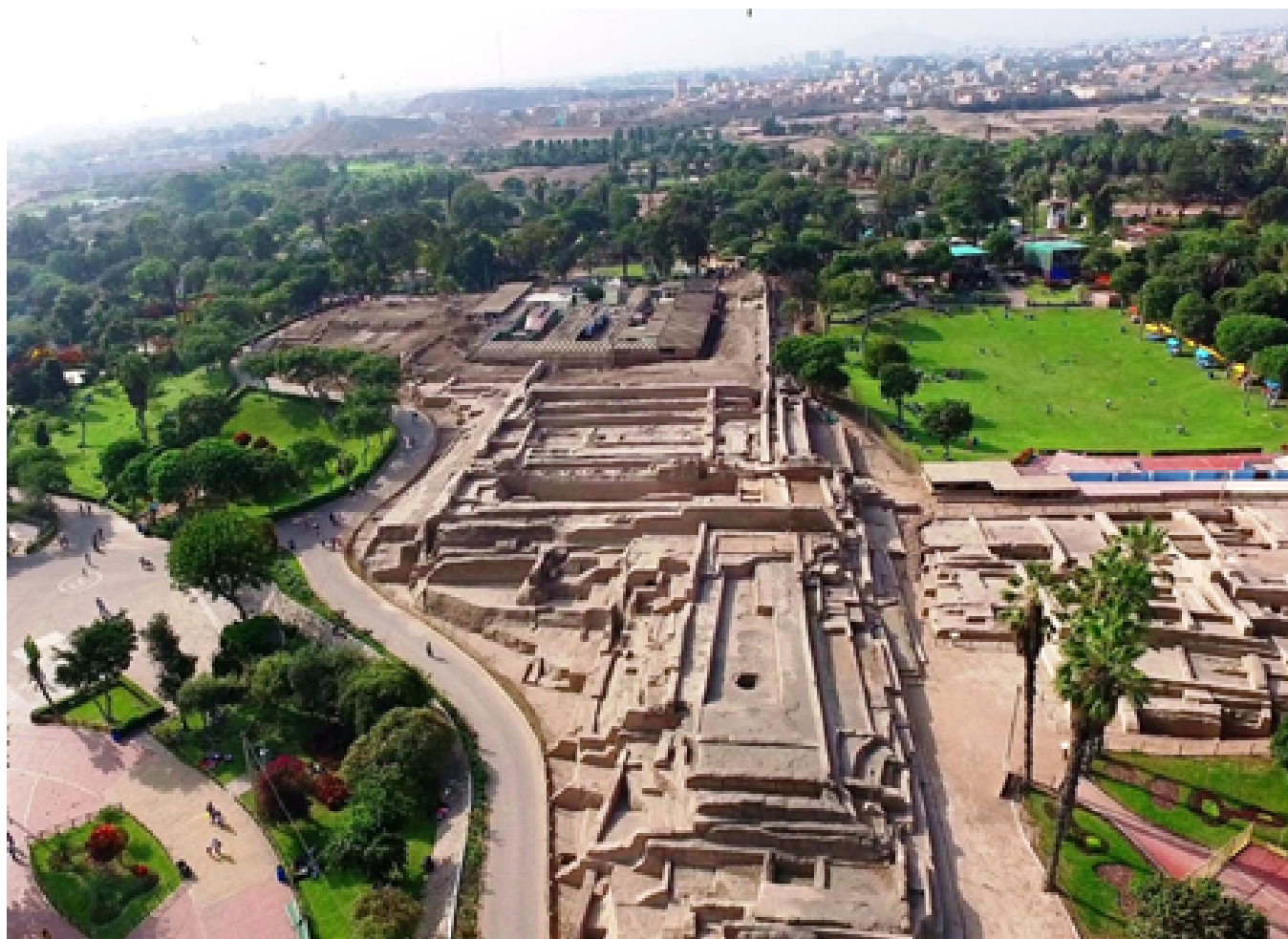
Fig. 3. Vista oblicua del Parque de las Leyendas.