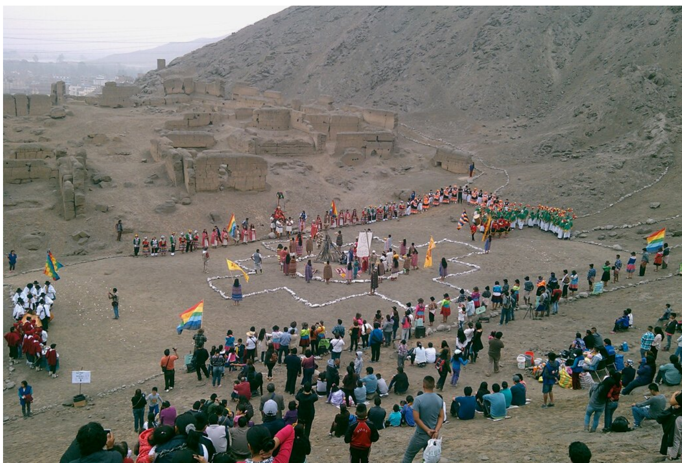
Fig. 6. Celebración del Inti Raymi en la Huaca fortaleza de Campoy