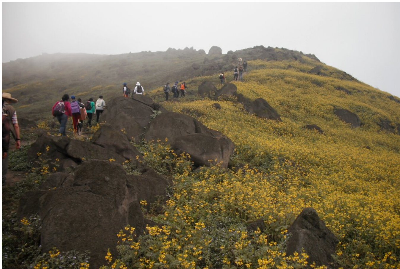
Fig. 7. Recorrido a las Lomas de Mangamarca

participe a la dinámica urbana, pero sin perder su condición patrimonial y generar en la comunidad apropiación e identidad local; no de manera impositiva, sino involucrando e identificando iniciativas locales para tener un punto de partida y una base de trabajo, donde se pueda maximizar su incidencia.