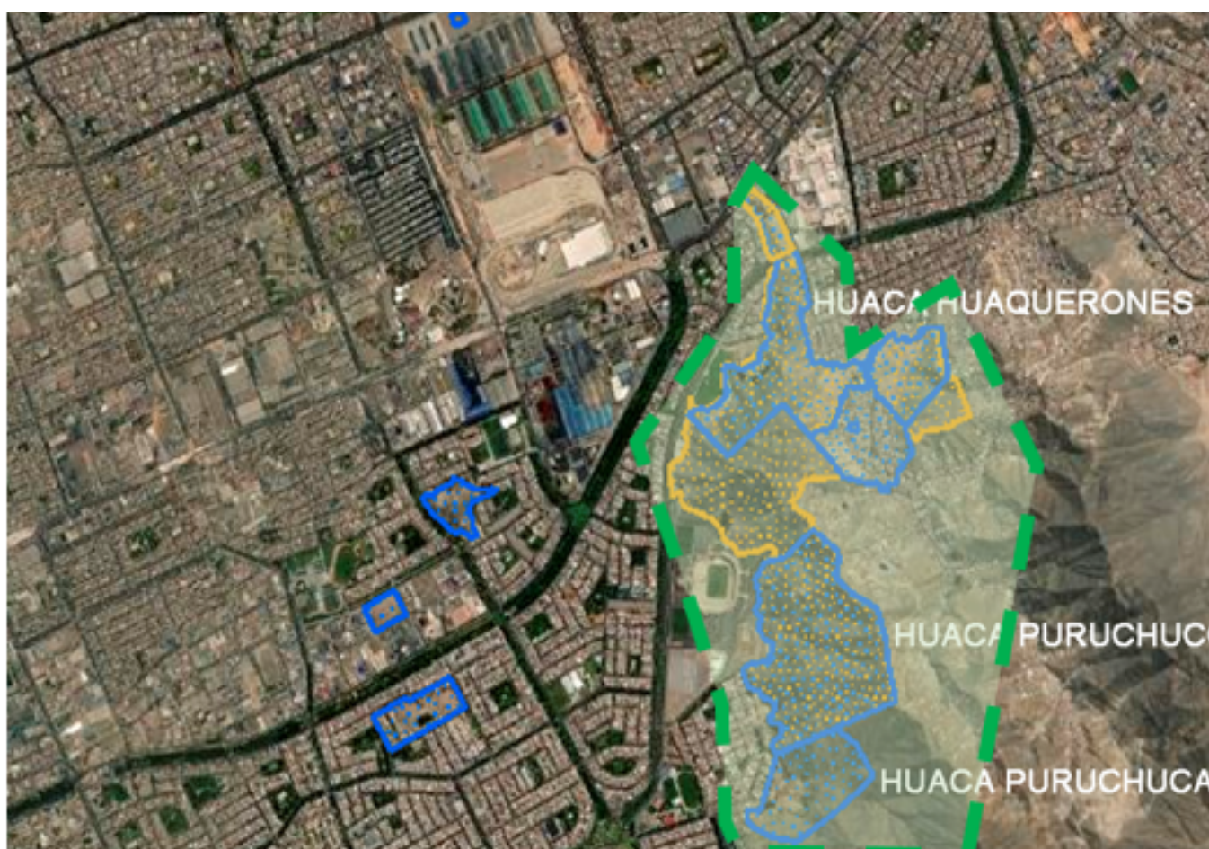
Fig. 2. Zona este de Lima..

En la zona norte de Lima están ubicados los sitios arqueológicos del Paraíso, la Muralla de Chuquitanta, Pampa de los Perros y Huaca Culebra; pero también están muy cercanos al río Chillón, el cual ha