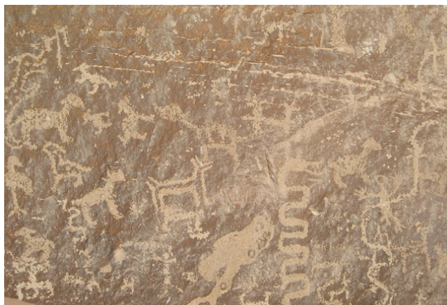
Fig. 16. Variedad de Cuadrúpedos

Existe un grupo de cuadrúpedos "posiblemente canidos" de trazo tosco, el cuerpo generalmente esta relleno, siempre están representados de perfil, con el hocico alargado, algunos con las orejas levantadas y otros con las orejas echadas hacia atrás que dan la sensación de que están en constante movimiento (Fig. 16).