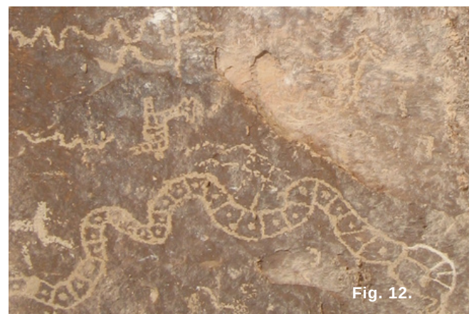
Fig. 12. (derecha), Representación de serpientes con decoración interior de líneas y puntos.