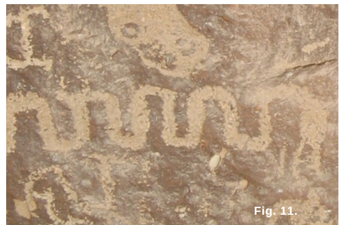
Fig. 11. Representación de serpiente con relleno.

La serpiente también está representada en varias secciones de La Laja. La más común de las serpientes ha sido trazada de forma esquematizada, como simples líneas ondulada, la cabeza con dos aspas en forma de flecha. Otro grupo de serpientes está representado por figuras más desarrolladas, con cuerpos rellenos en franjas onduladas de dos a tres centímetros de ancho (Fig. 11). Las más representativas las conforman aquellas serpientes de extraordinaria belleza, con el cuerpo delineado por dos líneas paralelas y adornado en el interior por líneas perpendiculares que forma cuadrángulos en cuya parte interna se han representado círculos, presenta rasgos faciales muy bien representados incluyendo los ojos (Fig. 12).