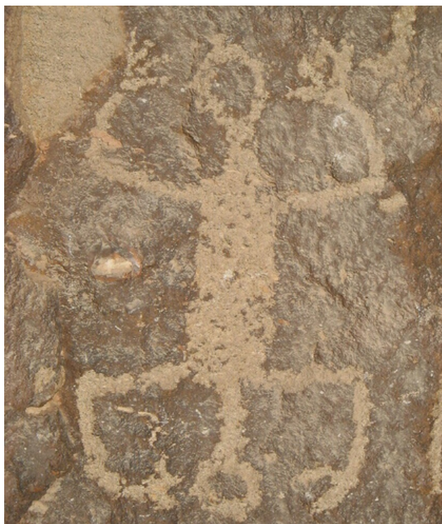
Fig. 15. Representación de personaje mítico o sobrenatural

En el lado norte del panel, rodeado de una serie de figuras geométricas y representaciones de fauna, resalta la figura de un personaje mítico o sobrenatural, el cual posee el cuerpo de frente con relleno, brazos extendidos y flexionados con los dedos abiertos, la cabeza está representada por un círculo delineado la parte baja del cuerpo es una representación idéntica de la parte superior, con un torso y cabeza delineada hacia la parte baja y lo que parecen ser dos brazos en la misma posición abierta y flexionada, aunque ligeramente distinto en la terminación de las manos que al parecer forman dos tenazas (Fig. 15).