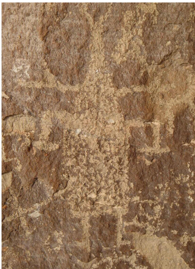
Fig. 14. Representación de personaje antropomorfo.

Es importante precisar, que en el panel se puedan identificar pocos personajes antropomorfos, registramos solo uno claramente visible, el personaje parece representar un danzante o chaman que aparentemente esté vestido con una camisa ancha tiene los brazos extendidos y flexionados hacia abajo, en la parte de la cabeza la representación ha sufrido algunos daños, sin embargo, pueden verse algunas líneas horizontales que salen de la altura del cuello y la cabeza termina en un círculo delineado (Fig. 14).