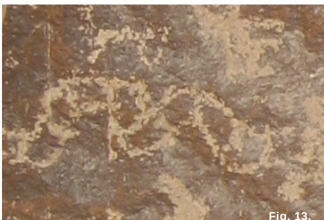
Fig. 13 Representación de serpiente al parecer imitando el diseño de la figura 12