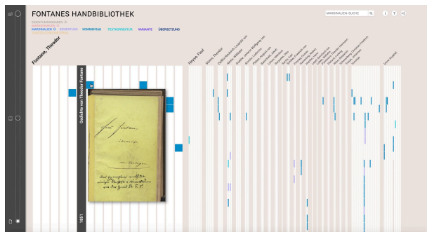
Abbildung 2. Seiten-Ebene mit hervorgehobenen Marginalien und Mouseover über ein Element

Vorschau des jeweiligen Seiten-Scans und den Buchtitel an (Abb. 2).