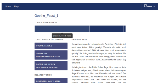
Abbildung 2. Übersicht für ein Dokument im Prototypen der Version 2