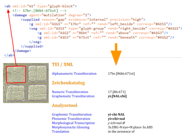
Abbildung 2. Übergang der maschinenlesbaren Textauszeichnung zur linguistischen Analyse

So kann der hieroglyphische Inhalt eines Texts maschinenlesbar dokumentiert werden, wobei die Entzifferungsgeschichte und hiermit einhergehende Veränderungen und Reinterpretationen einzelner Schriftzeichen auf der Ebene des Zeichenkatalogs abgebildet werden: Sollte sich die Interpretation eines Zeichens beispielsweise hinsichtlich seiner Semantik im Verlauf der fortschreitenden Forschung ändern, so bleibt die hieroglyphische Auszeichnung aller im TWKM erschlossenen Mayatexte unangetastet. Die Veränderung muss lediglich im Zeichenkatalog dokumentiert werden und steht danach als Information für alle Texte zur Verfügung. Gleiches gilt für die Entzifferungsgeschichte eines spezifischen Texts: Sollte die Deutung eines Graphems in einem konkreten Maya-Text revidiert werden, so erfolgt diese Änderung im Zeichenkatalog. Neu klassifizierte Zeichen werden im Zeichenkatalog durch die Relation owl:sameAs 7 mit den betreffenden falsch klassifizierten Zeichen verbunden. Damit ist garantiert, dass vormals falsch klassifizierte Zeichen weiterhin über deren URI auffindbar sind. 8 Die im Korpus referenzierten URIs vormals falsch klassifizierter Zeichen müssen dadurch nicht geändert werden und das kodierte Korpus bedarf keiner nachträglichen Überarbeitung.