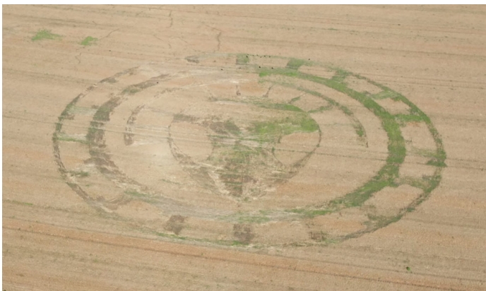
Figure 1 “Серый” инопланетянин в короне. Август 2019.

В статье “Вирус иммунного апгрейда HIV++. Гипотеза существования.” я описал как гипотетический вирус HIV++, морфологически напоминающий обыкновенный HIV, способен значительно усовершенствовать иммунитет человека. Я также предположил, что Чилболтонские рисунки на полях 2000-2002 годов являются своеобразным описанием некоторых свойств нового вируса. Такой вирус должен создать внутри человеческого организма независимую автономную иммунную подсистему, обладающую высочайшей чувствительностью к любым болезнетворным антигенам и способную легко идентифицировать и ликвидировать такие заболевания, как рак, туберкулёз или СПИД.