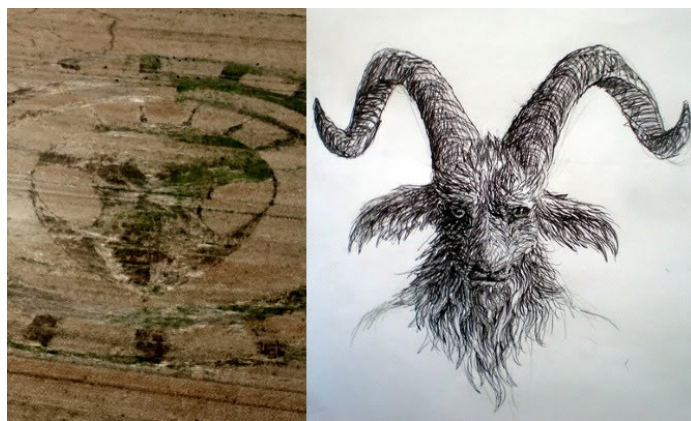
Figure 6 Образ зверя на рисунке “Серого”

11. И купцы земные восплачут и возрыдают о ней, потому что товаров их никто уже не покупает