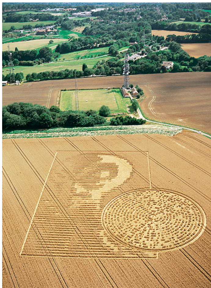
Figure 3 Изображение “Инопланетянина” с CD диском.

В августе 2019 года на пшеничном поле предположительно в Великобритании возникло изображение, которое возможно имеет отношение к новому вирусу SARS-CoV-2. Рисунок проявился только после того, как поле скосили и был составлен из зелёных стеблей пшеницы, выделявшихся на жёлтом высохшем поле. Очевидно, что