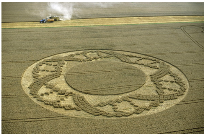
Figure 2 РНК нетрадиционной геометрии.

Некоторые исследователи отмечают, что новый вирус SARS-CoV-2 ведёт себя достаточно странно. Организм человека поражается не столько самим вирусом, сколько в результате неадекватного иммунного ответа. Если речь идёт о гуморальном иммунном ответе, инициируемом В-лимфоцитами, возникает эффект антигенного усиления инфекции. Вирус, захваченный антителом оказавшись внутри макрофага, открепляется там от антитела и начинает размножаться. Чем больше антител, тем активнее заражение. Если речь идёт о клеточном иммунитете, инициируемом Т-лимфоцитами, то может возникнуть “цитокиновый шторм”. Если бы иммунная подсистема HIV++ смогла защитить SARS-CoV-2 от оригинальной иммунной системы, то коронавирус мог бы с большим дружелюбием принять HIV++ в свой капсид. При этом HIV++ смог бы научиться летать яко обычная простуда. Вместе со своей собственной генетической информацией, в капсид коронавируса он мог бы также подцепить информацию из базы данных автономной иммунной системы. Разумный дизайн должен подразумевать именно это.