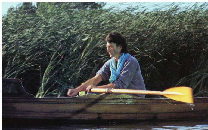
Figure 5 “Signs of Life” гребец на каноэ.

Первая композиция “Signs of Life” начинается со скрипа вёсел и звуков плеска воды. “Signs of Life” было одним из вариантов названия альбома. На круглом экране во время концертов демонстрировался клип с гребцом на каноэ, плывущем по реке. Автором клипа был британский фотограф Сторм Торгесон который также создал и обложку альбома. Автором музыки был гениальный гитарист Давид Гилмор. Река из клипа соответствует реке из больничных кроватей. Всё это может быть признаками жизни того, кто создал вид Homo Sapiens.