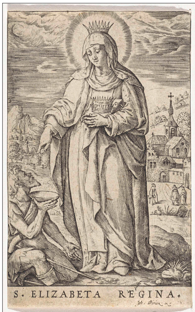
1. kép: Johannes Wierix, Szent Erzsébet, Rijksmuseum Amsterdam, RP-P-1904-1248

a magyar koronához hasonló jelvényt használt a családi címerében is 1594-ben. 18 1605-ben Dél-Németalföldön megjelent egy színdarab Szent Imréről, amelyben a jezsuita szerző ismét a Croÿ család elképzelt Árpád-házi gyökereit hangsúlyozta. 19 Ebben a kontextusban kell vizsgálni Szent István király alakját, ami több