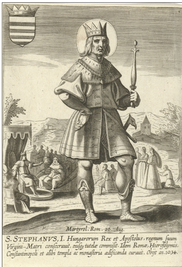
2. kép: S. Stephanus, I. Hungarorum Rex et Apostolus