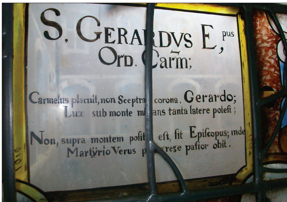
6. kép: Szent Gellért a boxmeeri kolostorban, Pal Haanen felvétele