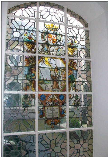
4. kép: Szent Gellért a boxmeeri kolostorban