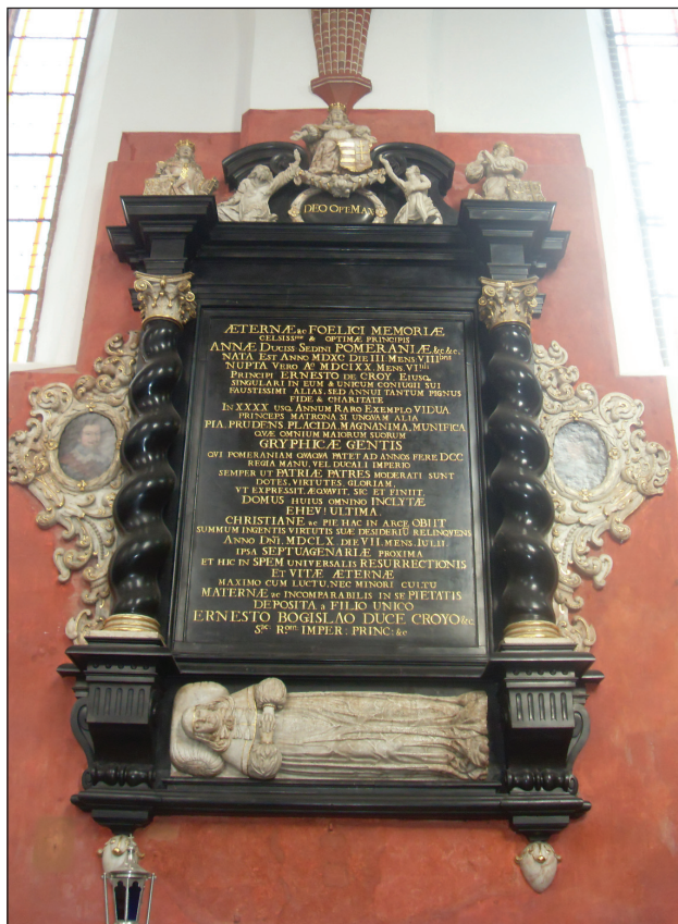
9. kép: Anna van Croy síremléke.