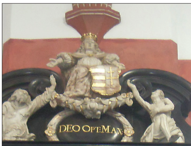
10. kép: Anna van Croy síremléke.