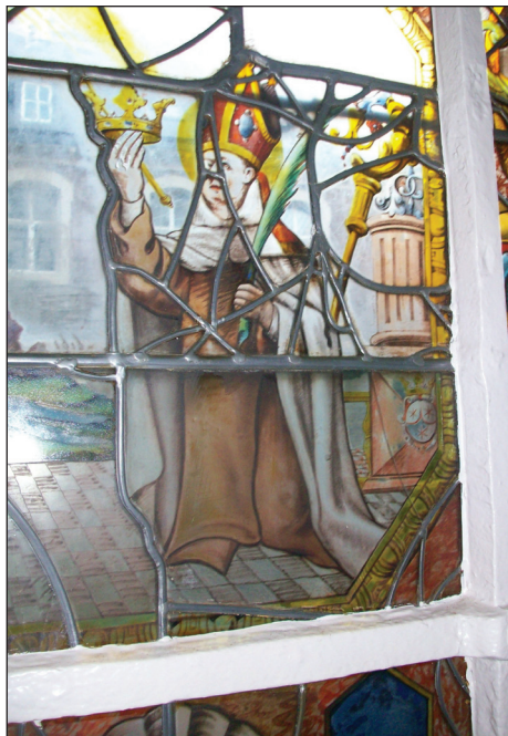
5. kép: Szent Gellért a boxmeeri kolostorban