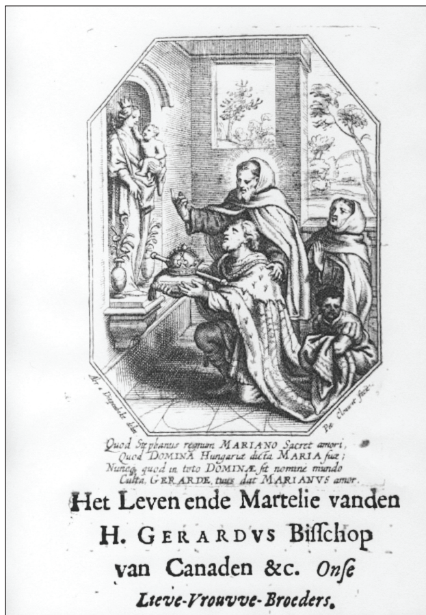
3. kép: Szent Gellért és Szent István in: Oliverius a Sancto Anastasio: Gheestelycken lvtst-hof der carmeliten. Antwerpen 1661. II. 94.

mutatta be a Croÿ család magyar gyökereit. 22 Figyelemre méltó, hogy ezek a legitimáló röpiratok, könyvek és rézkarcok akkor jelentek meg, amikor Magyarországon politikai válság volt, a Bocskai felkelés idején (1604–1606), II. Mátyás és I. Rudolf közötti testvérharc időszakában (1607–1612) és Bethlen hadjáratainak idejében (1619–1626).