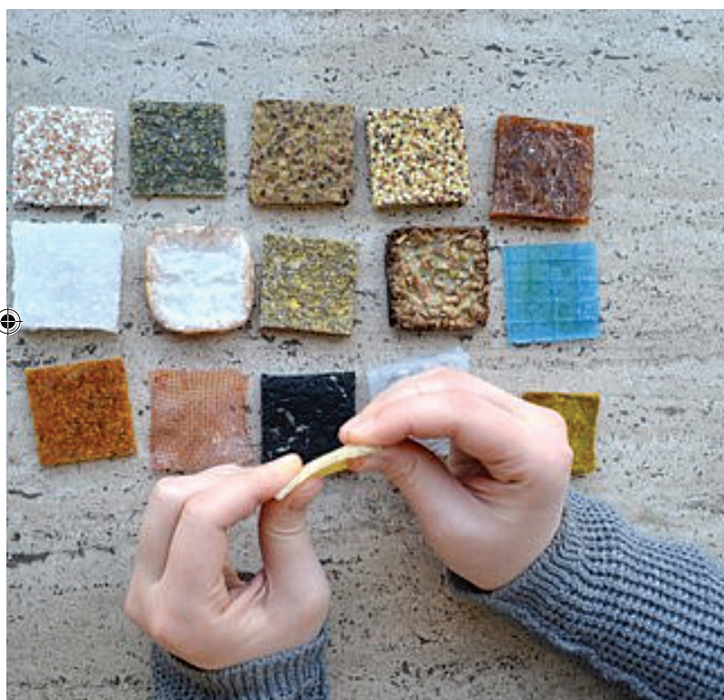
Os bioresíduos da transformação do azeite podem também ser usados para produzir biomateriais. Cecilia Cecchini