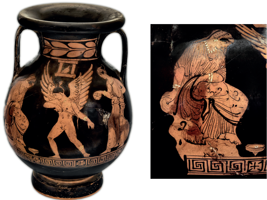
FIG. 8 A-B