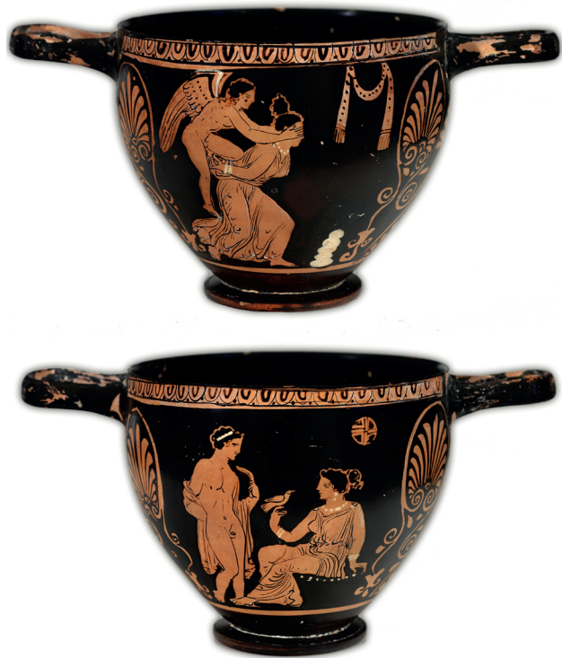
FIG. 1 a-b