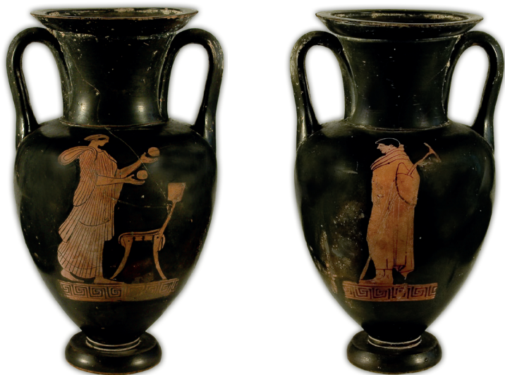
FIG. 3 a-b