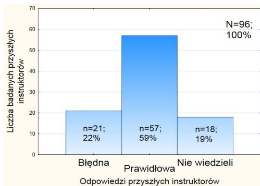
Ryc. 1. Rozkład odpowiedzi na pytanie: Czy regularny wysiłek fizyczny w ciąży, bardziej wyczerpujący niż marsz, może prowadzić do poronienia?

Z przeanalizowanych danych wynika, że tylko 59% badanych ( n=57 ) wiedziało, iż regularny wysiłek fizyczny, bardziej wyczerpujący niż marsz nie prowadzi do poronienia. prawie połowa przyszłych instruktorów (41%, n=39 ) nie była w stanie podać prawidłowej odpowiedzi na zadane pytanie.