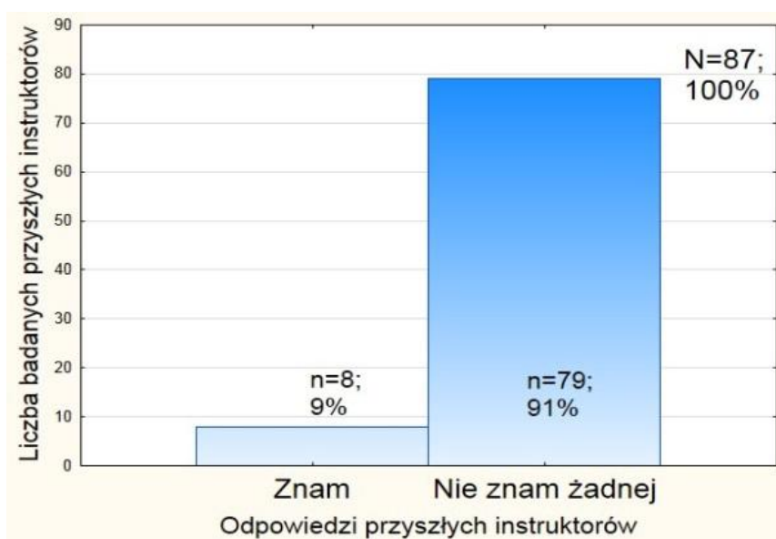
Ryc. 4. Rozkład odpowiedzi na pytanie: Jakie znasz metody określania intensywności aktywności fizycznej kobiet w ciąży?

Tylko 44% badanych (n=42) wiedziało, iż wyraźne osłabienie mięśni nie wlicza się do grupy takich symptomów; 36% badanych (n=34) odpowiedziało błędnie, a 20% (n=19) zaznaczyło odpowiedź „nie wiem”.