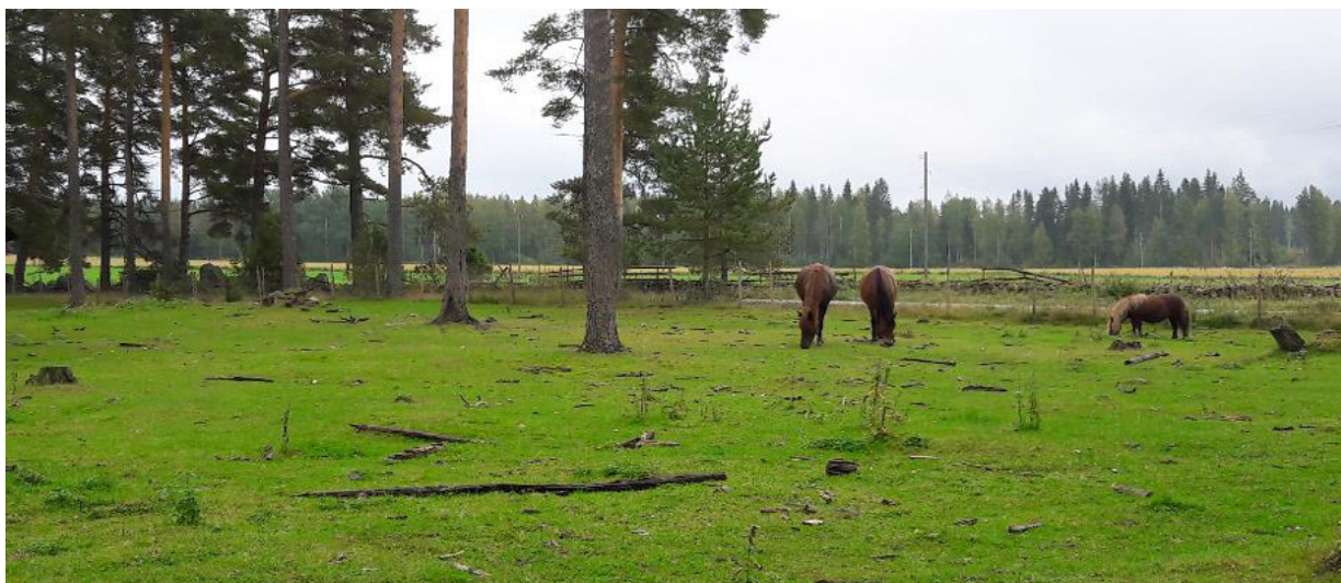
Kuva 3. Hevoset laitumella