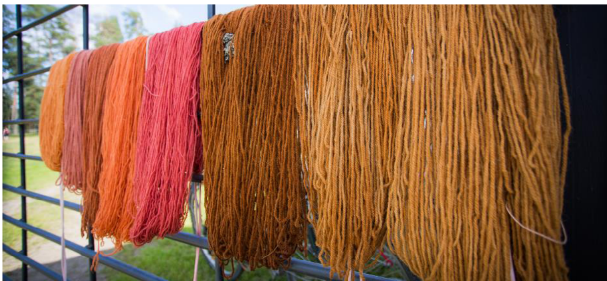
Kuva 4. Värjättyjä villalankoja. Sampo Luukkainen

Pajakankaan perinnebiotooppia (5 ha) hoitavat tilan kaksi suomenhevostammaa ja kesäisin siellä laiduntavat myös muut hevoset. Kunnollisen hoidon myötä laidunnettujen metsälaidunten monimuotoisuus on korkeammalla tasolla kuin laiduntamattomien.