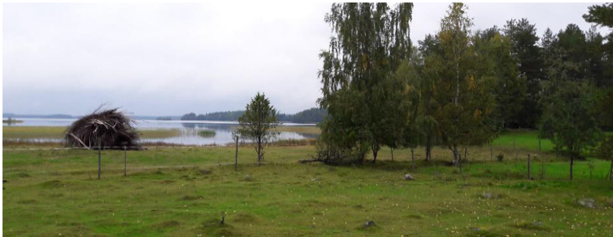
Kuva 2. Laudun järven rannalla