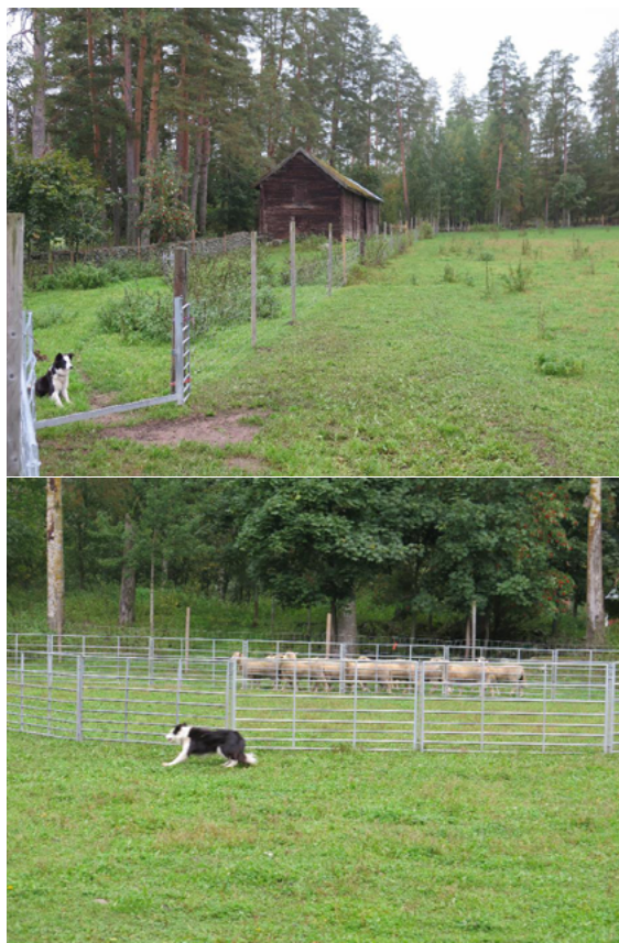
Kuva 1. Inka valmiina töihin ja Inka työn touhussa

Tilalla on sekä Dorset-rotuisia lampaita että suomenlampaita. Dorsetilla on liharoduksi korkea hedelmällisyys, maidontuotantokyky sekä erinomaiset emo-ominaisuudet. Sillä on myös hyvä rehunkäyttökyky ja se on tarkka ja rauhallinen laiduntaja. Putkisalossa dorset-lampaita kasvatetaan risteytystuotantoon: suomenlammasuuhia astutetaan dorset pässillä, jolloin saadaan taloudellisia helppohoitaisia finndorset uuhia emoiksi lihantuotantokatraisiin. Paras hyöty finndorset uuhista saadaan astuttamalla ne kolmannella rodulla esim. Texel tai Oxford Down.