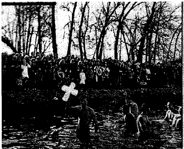
Хвајшање крста у Морави на Божијављење, Чачак 2007. године

да већина народа и даље живи „незнабожачким“ животом и да је повратак цркви тренутни „бљесак“. Наглашаван је значај веронауке, али и васпитања у породици. Упућен је апел вероучитељима да укључе децу у активан верски однос и хуманитарне акције, јер вера значи и жртву: „Још увек имамо стиару љраксу . Дођемо у храм да ујал- имо свећу и одмах одемо и смајрамо да смо своју дужност према Богу испунили. Такав верник лишурђијски не живи, није дошао да буде на богослужењу од почејка до краја и да саборно учес твује у молињи .“ 387 Црква није била задовољна посетама храмовима који су и даље остајали празни, а то је једино мерило религиозности. 388