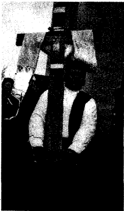
Прослава Бођојављења у Чачку 2007. године

ологије. Побожност је истовремено била саставни део вредносне оријентације људи која се преламала у сфери политике и употреби религиозних ставова и осећаја у обликовању друштвених односа, сукоба и разрачунавања нарочито током Другог светског рата, али и у дугим деценијама у другој половини XX века.