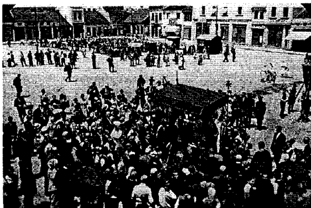
Владика Николај у Чачку на Сјасовдан 1939. године