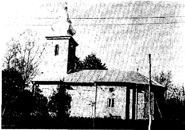
Црква у Мрчајевцима

(Милан Ђоковић, „Где је Бог у Мрчајевцима после лета у космос“, Чачански глас , бр. 5, 29. јануар 1969. стр. 5).