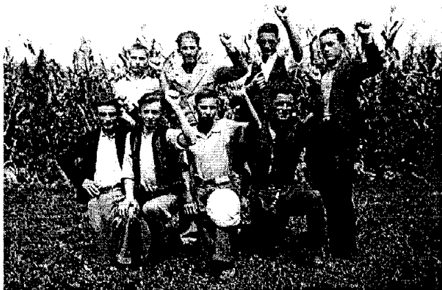
Скојевици Чачка 1936. године

(Гвозден Адамовић, „Хришћанство између комунизма и фашизма“ ПЦЕЖ, бр. 1, Чачак, јануар 1937, стр. 13-17)