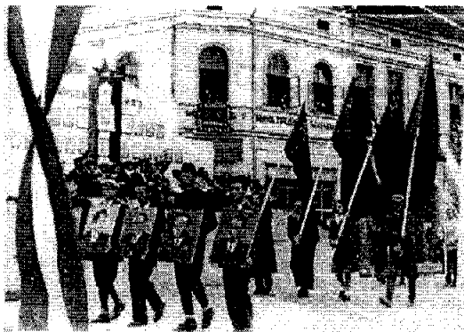
Лигија живим „свештићелима“ – првомајска парада у Чачку 1950.

(М.К., „На прљавом послу“, Чачански глас , бр. 306, Чачак, 25. март 1952, стр. 2).