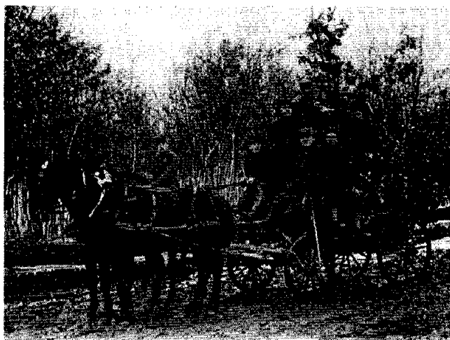
Доношење бадњака у Чачак пред Друџи свейски райи

асијирска добра предаду народу, а проишв рђавих духовника довео је посијуиак“. Нови епископ је критикован због обустављања тих поступака. 207 Коментарисане су и Николајеве беседе. Левичари су сматрали да епископ мало говори о реалним проблемима сиромашних, посебно обућара, у вези њихове пропасти услед конкуренције индустријске обуће фирме „Бата“: „Сиротиим обућарима нису пошребне приче о заџробном живоју, њима пошеба хлеба, за њих и њихову децију“. 208 Економска криза из 1929. године са закашњењем је захватила Југославију. У Чачку је тако почетком 1934. године било око 1.200 лица којима је била неодложно потребна помоћ. Тај број се поклапао са укупним бројем незапослених и члановима