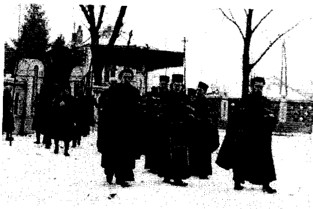
Богојављење у Чачку 1939. године

Повезаност државе и цркве добијала је јасне обресе и приликом свечаности Сокола, који су на