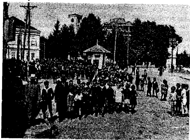
Деца испред цркве у Чачку на Цветић ње 1929. године

Црквене власти у чачанском крају признале су 1931. године да је замена учитеља на пољу веронауке у основним школама тежак посао, али да нема одступања на „пољу религиозно-морално-просветном преображају друштва“. 83 Поред ширења основних хришћанских вредности код одраслих особа, црква је покушавала да већ код младих генерација сузбије негативна понашања. Црква је са просветним властима у чачанском крају од 1932. године покушавала да непрестаном педагошком акцијом смањи, сузбије и искорени веома раширену псовку; најпре код деце у школи, а онда преко њих и у целом друштву. Такође се борило против непрестаног заклињања у Бога поводом најбаналнијих разлога у свакодневном животу. 84