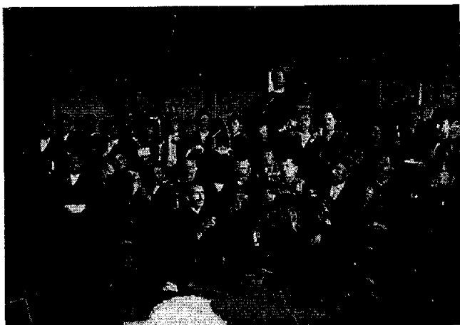
Бекријање на велики понедељак у Чачку пред Друџи светјски рај

подигнута је црква посвећена кнезу Лазару у српско-византијском стилу, по пројекту Драгослава Маслаћа. Изградња је коштала 180.000 динара, а један од приложника био је и краљ Александар. 140 Завештање разних материјалних добара, од звона до богослужбених предмета, са јасном назнаком у чије се здравље прилаже, био је уобичајени вид исказивања побожности имућнијих грађана у жичкој епархији. 141