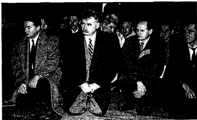
Ново општинско руководство Чачка поклаже заклетицу у цркви 1996. године

ка. 359 Поједини успешни приватници тек су средином деведесетих, под утиском смрти родитеља, али и слободног деловања цркве, поништили своју марксистичку прошлост и пригрлили православље „као једини пут спасења“. 360