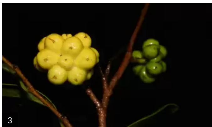
Foto 1: Annona maritima (Záchia) H.Rainer Foto 2: Annona maritima (Záchia) H.Rainer Foto 3: Annona maritima (Záchia) H.Rainer