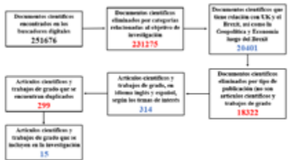
Diagrama esquemático de selección de documentos científicos que fueron seleccionados para el desarrollo de la investigación.

Estos 15 documentos científicos seleccionados presentan diversos temas que involucran una información