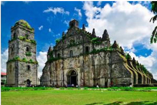
Convento de San Agustín en Paoay (Filipinas)