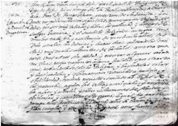
Pregunta 21 (fol. 5r). Información realizada en 1597