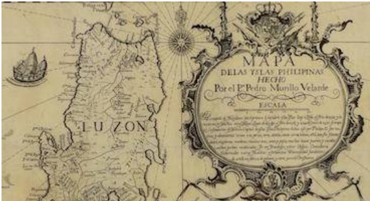
Nueva Segovia. Carta hydrographica y chorographica de las Yslas Filipinas (1734)