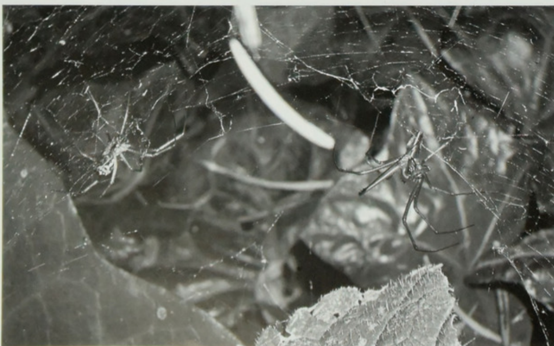
Abb. 4: Linyphia triangularis – Weibchen links, Männchen (mit vergrößerten Chelizeren) rechts im Netz.

als Beispiel für die sogenannte Kontrastbetonung. Bei sympatrischen Vorkommen der Konkurrenten verschieben sich die Körpergrößen bei L. tenuipalpis zu kleineren, bei L. triangularis zu größeren Werten, dadurch kann unterschiedlich große Beute genutzt werden. Auf diese Weise wird die Nischenüberlappung verringert und die direkte Konkurrenz geringer (Toft 1980). Toft (1987) zeigt allerdings auch, dass die Mikrohabitate der beiden Arten fast identisch