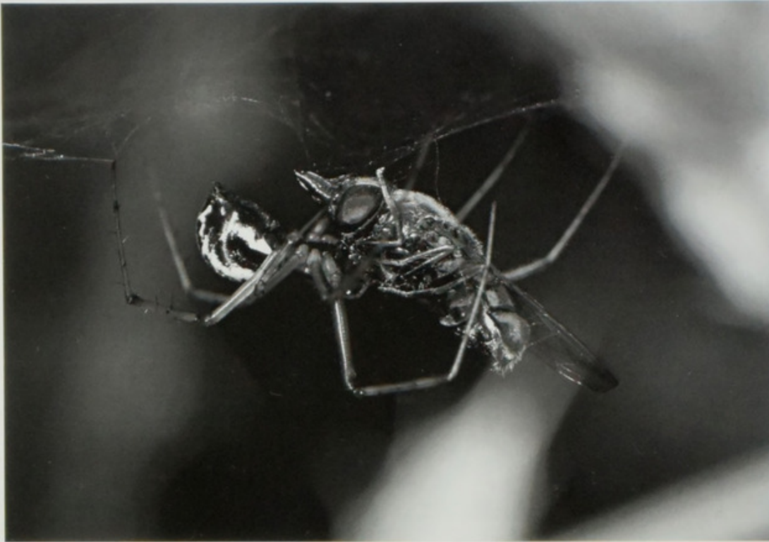
Abb. 3: Linyphia triangularis mit Beute.

Fig. 3: Linyphia triangularis with prey.