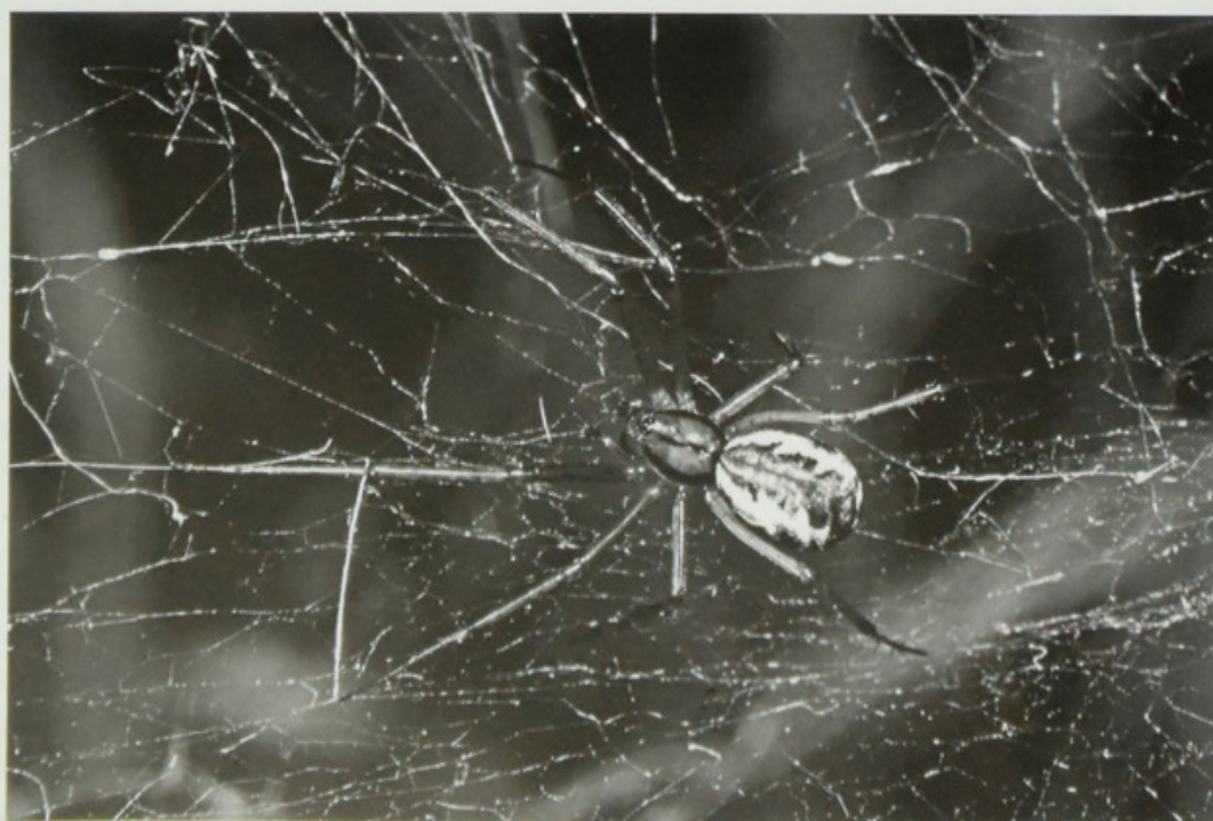
Abb. 1/Fig. 1: Linyphia triangularis – Habitus.

eingereicht 25.3.2014, akzeptiert 5.4.2014, online 12.5.2014