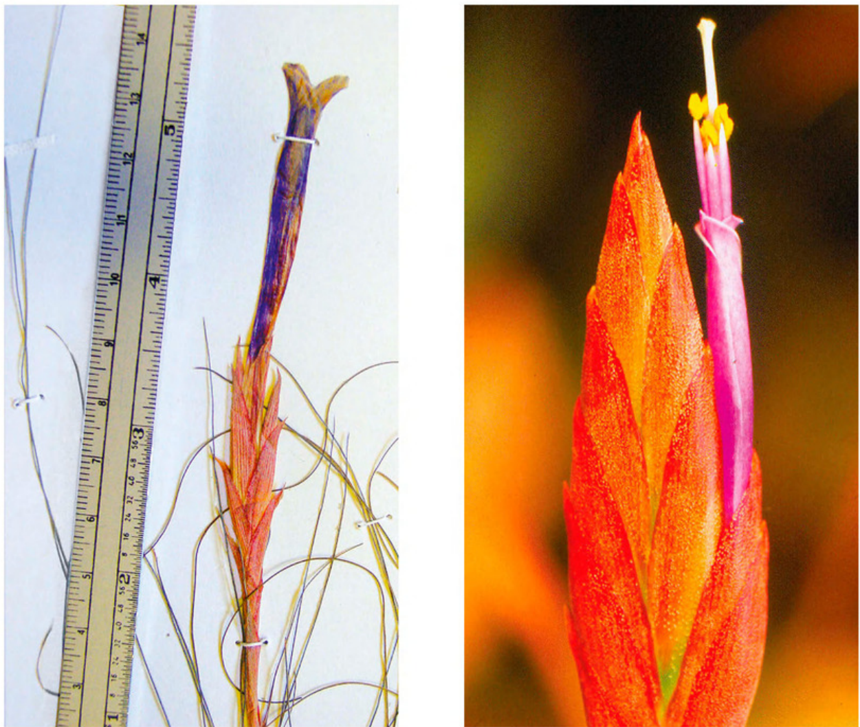
Fig. 2. A. Tillandsia chaetophylla Mez. (detalle del ejemplar: A. Salinas y E. Martínez 5980 (MEXU) B. Tillandsia sessemocinoi Espejo, López-Ferrari y Blanco (fotografía de la espiga correspondiente al espécimen: A. R. López-Ferrari et al. 2780).

espiga oblonga a oblongo-elíptica, aplanada, de 3.5 a 5.5 cm de largo por 1 a 1.3 cm de ancho; brácteas florales rosadas, oblongo-lanceoladas, de 2.2 a 2.5(2.7) cm de largo por 8 a 10 mm de ancho, más largas que los entrenudos, imbricadas, nervadas, ecarinadas, lepidotas, acuminadas y excurvadas en el ápice; flores dísticas, erectas, 3 a 4(5) por espiga, actinomorfas, subsésiles, formando una corola hipocraterimorfa; sépalos verdes, angosta y largamente lanceolados, de 3 a 3.2 cm de largo por 3.5 a 4 mm de ancho, nervados, glabros, con un amplio margen hialino, largamente atenuados a acuminados en el ápice, los dos posteriores carinados y connatos en casi toda su longitud; pétalos libres, de color violeta, oblongo-espatulados, de 6.5 a 6.8 cm de largo por 6 a 7 mm de ancho, redondeados a agudos y excurvados en el