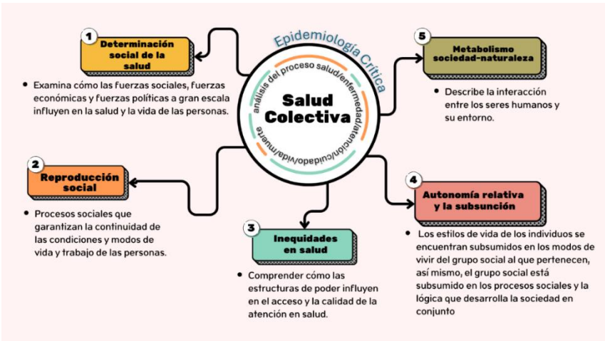
Figura 1. Ejes conceptuales de la Salud Colectiva