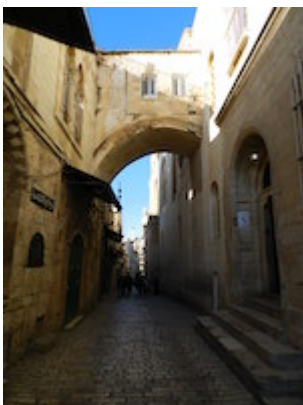
Arco del Ecce Homo