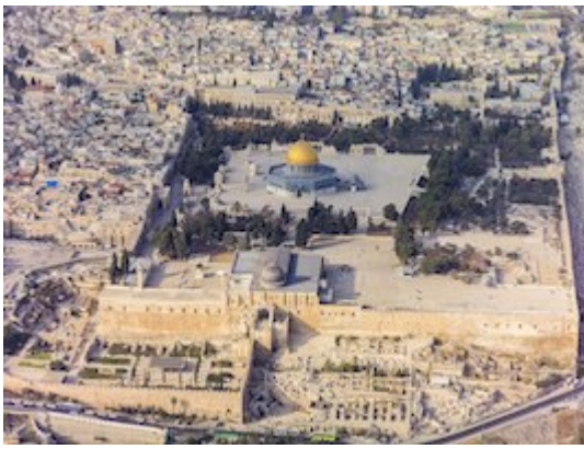
Monte del Templo