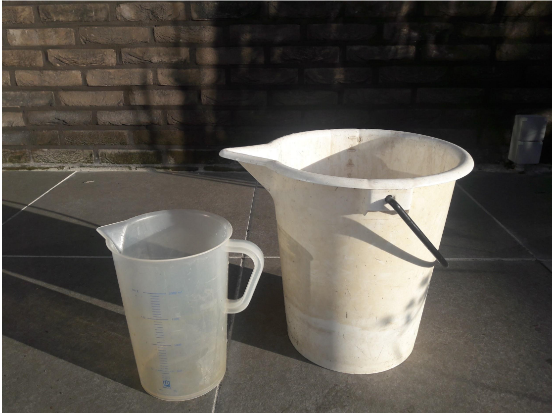
Figuur 7.2: Maatbeker (links) en staalname-emmer (rechts).