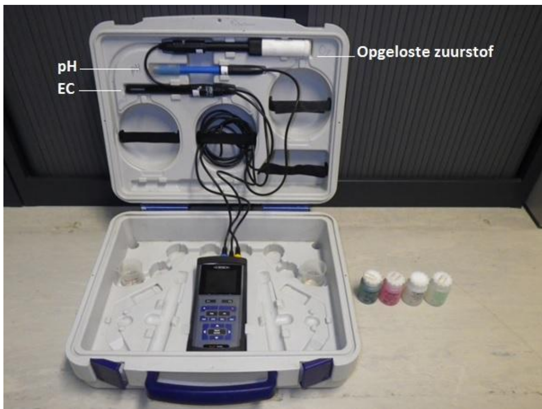
Figuur 7.1: Digitale veldmeter type WTW Multi 3430, met zuurstof-, zuurtegraad- en geleidbaarheidselektrode en bijhorende buffer- en kalibratievloeistoffen.