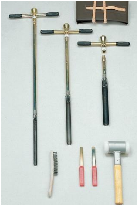
Figuur 7.1.: Links (Foto 1): Set van gutsboren voor gebruik in zachte gronden ©Eijkelkamp; Rechts (Foto 2): Set van gutsboren voor een iets hardere bodem. De gutsen zijn voorzien van een slagkop waarop men met een terugslagvrije hamer kan slaan om de guts dieper in de grond te brengen. ©Eijkelkamp