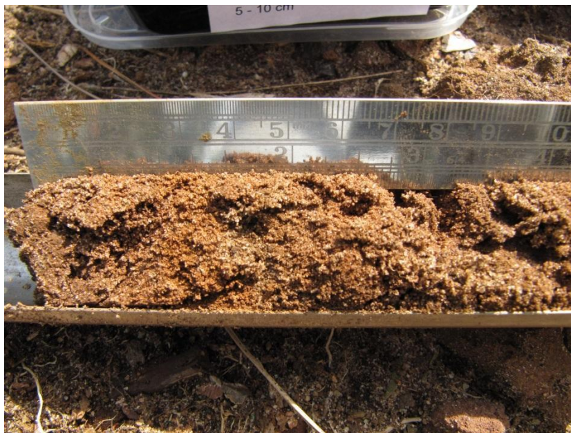
Figuur 8.3.: Minimaal geroerd bodemmateriaal bij bodembemonstering met een guts