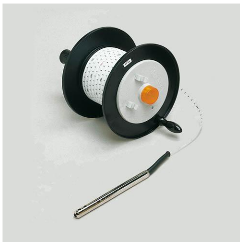
Figuur 7.2: Meetlint met elektrische sensor.