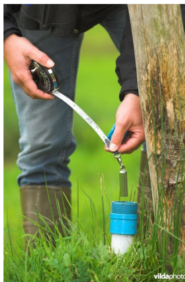
Figuur 7.1: Meetlint met klokje.