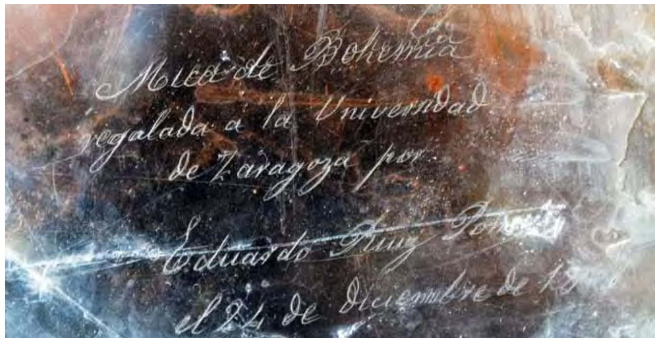
Detalle de la lámina de mica de la figura anterior, con la etiqueta grabada.