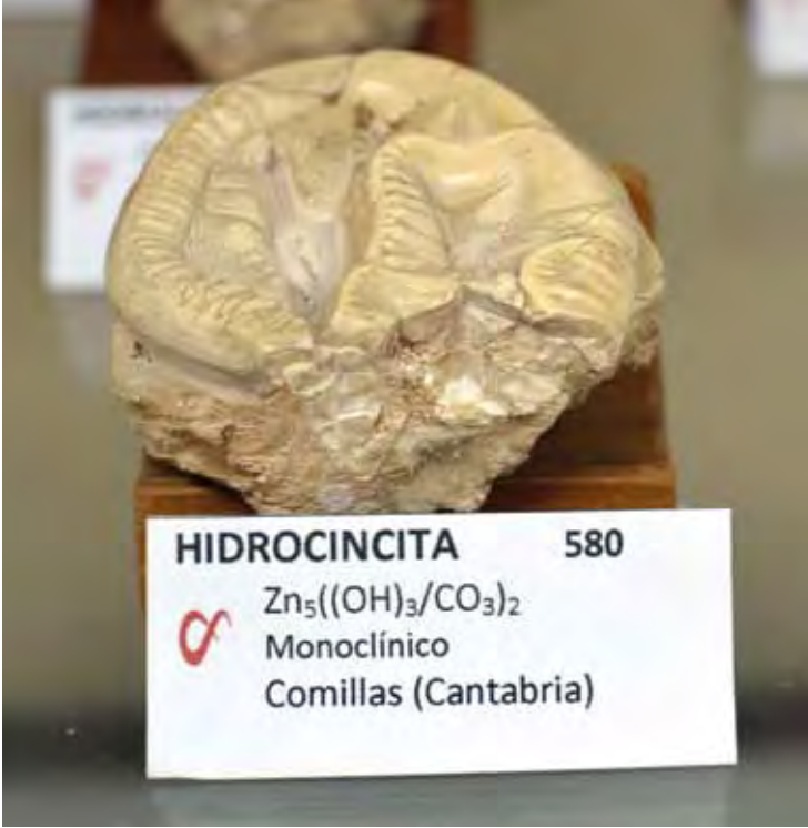
HIDROCINCITA 580 Zn5((OH)3/CO3)2 Monoclínico Comillas (Cantabria)

Una de las explotaciones mineras de baritina más importantes de España, ahora cerrada y rellena, ha sido la corta de la mina "Santa Matilde", en Cuevas del Almanzora (Almería). Una particularidad de este yacimiento, especialmente en la parte central, es la presencia