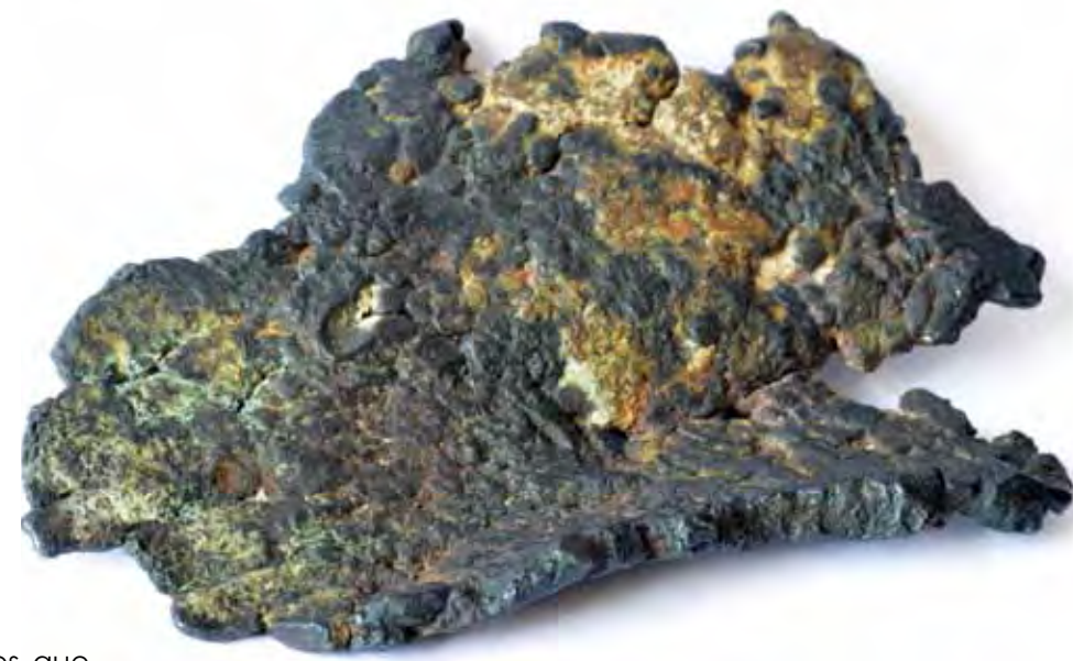
Imagen por Jesús Fraile.

Los ejemplares de minerales que forman la colección se eligieron indudablemente con varios criterios: el primero, y más evidente, la representación de los minerales útiles, como las menas metálicas, y los minerales con utilidad industrial, como el yeso. Llama la atención la abundancia de ejemplares de "fosforita", variedad microcristalina de apatito. También es evidente la presencia prioritaria de ejemplares de yacimientos españoles (obviamente las razones económicas también cuentan en este caso), y especialmente de los regionales. La colección entregada a Zaragoza incluye piezas procedentes de los yacimientos aragoneses más conocidos, así como de otros yacimientos españoles, como las minas de plata de Hiendelaencina, las de plomo de Linares y las de cinc de Cantabria. Entre los ejemplares se encuentran varios cuya calidad indica que su destino es el examen visual, mientras que en otros casos, incluidos duplicados de los primeros, parecen más bien ejemplares que aceptarían la "manipulación agresiva", como examen de dureza, color de la raya, etc.