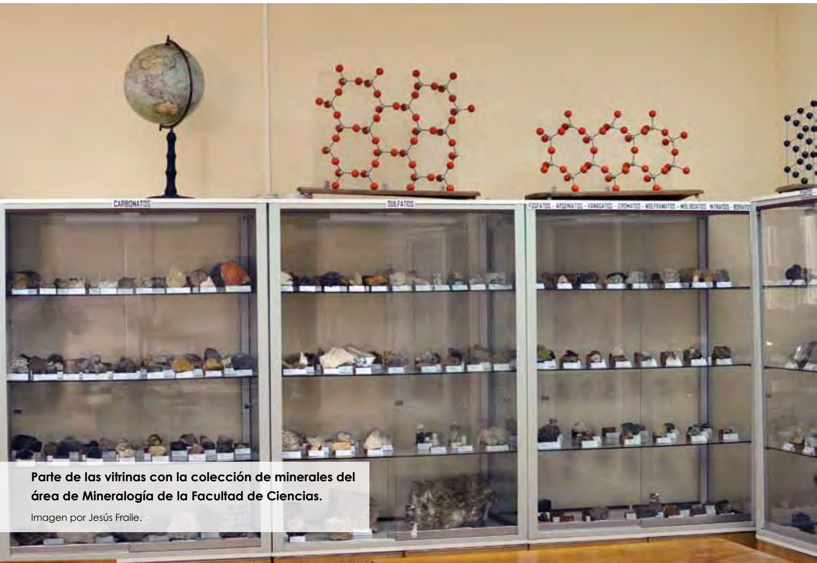
Parte de las vitrinas con la colección de minerales del área de Mineralogía de la Facultad de Ciencias.