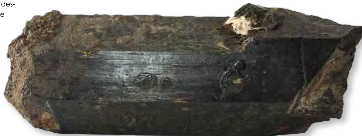
Etiqueta de una pieza de mineral de plata, en la que indica que procede de la mina Santa Cecilia, en Hiendelaencina (Guadalajara), y la fecha de 2 de junio de 1844 (arriba).

vidrio, con su caja, casi completa, y otra colección de pseudomorfosis. Con etiqueta de Eger existe un ejemplar de tetradimita con cuarzo de Carrock Fells, Cumberland (Gran Bretaña). Los ejemplares más importantes no conservan su etiqueta original, de modo que no puede saberse quien los proporcionó. Entre los más notables pueden señalarse un ejemplar de egirina y otro de eudialita, dos silicatos raros que según sus etiquetas proceden de Groenlandia, sin más detalles. El ejemplar de egirina consiste en un cristal incompleto, de 7 cm. de longitud. Con estas características, su origen casi seguro es la localidad de Narsarsuk, la única conocida en Groenlandia en la que aparecen cristales de este mineral de gran tamaño (hasta 20 centímetros de largo), y que ya era bien conocida en la época probable de adquisición de estos ejemplares (Boggild, 1953). El ejemplar de eudialita consiste en un grupo de cristales de