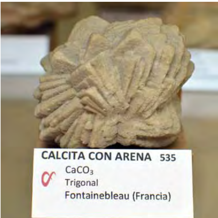
CALCITA CON ARENA 535 CaCO3 Trigonal Fontainebleau (Francia)