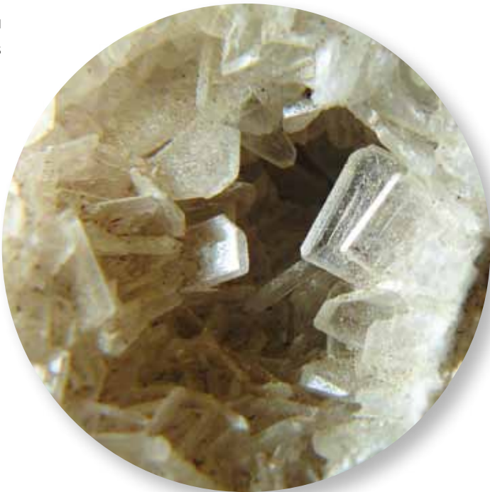
Imagen por Faustino Rodríguez.

de fumarolas fósiles formadas por baritina, en las que este mineral presenta estructuras tubulares de aspecto coraloide, con la parte interior finamente bandeada y las paredes de los huecos recubiertas por microcristales tabulares transparentes.