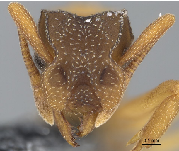
Figure 2. Cyphomyrmex minutus MAYR, 1862. Ouvrière, tête vue de face. Spécimen CASENT0264753 Antweb. https://www.antweb.org

d'un isolat sur l'île de la Réunion intrigue et interroge car, à ce stade, c'est la seule région où cette espèce est connue en dehors du continent américain dont elle provient. Ce constat est étonnant car les Attini ne sont pas spécialement connus pour leur propension à coloniser de nouvelles régions aussi éloignées de leur territoire d'origine ( comm. pers. B. GUENARD, 2023). De ce point de vue, cette fourmi doit être considérée comme une espèce atypique et singulière au sein de l'entomofaune réunionnaise.