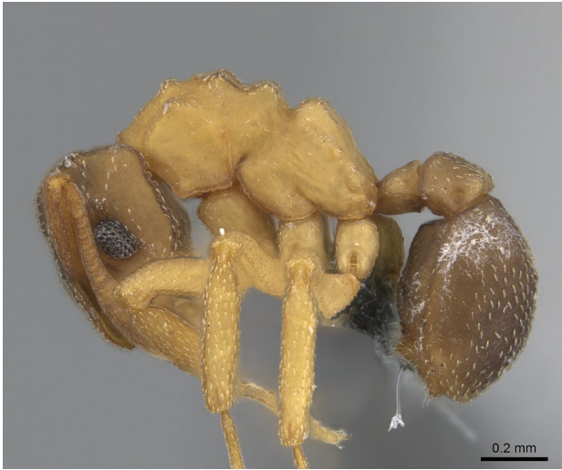
Figure 3. Cyphomyrmex minutus MAYR, 1862. Ouvrière de profil. Spécimen CASENT0264753 Antweb. https://www.antweb.org