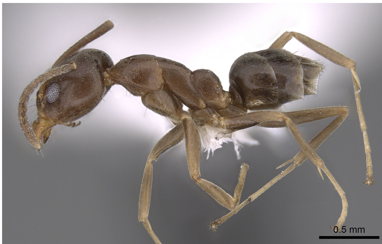
Figure 1. Linepithema humile (MAYR, 1868). Ouvrière de profil. Spécimen CASSENT0281314 Antweb. https://www.antweb.org

Dans certaines régions du globe, l'espèce est tolérante aux températures plus basses comprises entre 9,8 et 13,5 °C (RUSSEL COLE et al. , 1992) 2 et s'accommode de variations hygrométriques plus importantes que les autres espèces (MENKE & HOLWAY, 2006). À la Réunion, qui réunit tous ces facteurs abiotiques, elle pourrait donc facilement s'y développer (BLARD, 2006). Une fois répandue, son éradication serait alors quasi-impossible. Quant aux méthodes de contrôle, elles s'avèrent coûteuses et souvent inefficaces (ANGULO et al. , 2022). Nous ne savons pas à ce stade si cette implantation reste localisée ou d'ampleur, mais la colonie d'origine nécessiterait une destruction des nids selon la méthode inspirée d'INOUE et al. (2015).