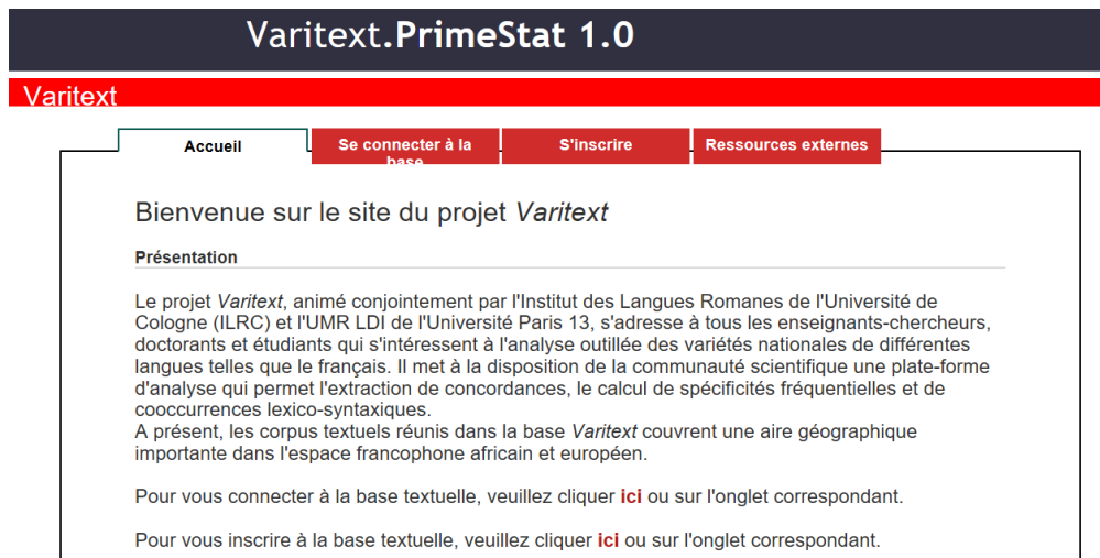
Abb. 1: Die webbasierte Plattform Varitext .

1 Das Projekt Varitext hat zum Ziel, Textressourcen, und zwar konkret linguistische Korpora, sowie eine online zugängliche Arbeitsumgebung für deren Analyse bereitzustellen. Dabei sei unter Textressourcen allgemein jede beliebige Art von digitaler Textsammlung verstanden, unter einem linguistischen Korpus hingegen speziell eine zu sprachwissenschaftlichen Zwecken zusammengestellte und aufbereitete digitale Textsammlung (s. u.). Varitext ist zugleich jene webbasierte Arbeitsumgebung ( plateforme ), die Zugang zu den Korpora und den damit verknüpften Analysetools verschafft (siehe Abb. 1 ).