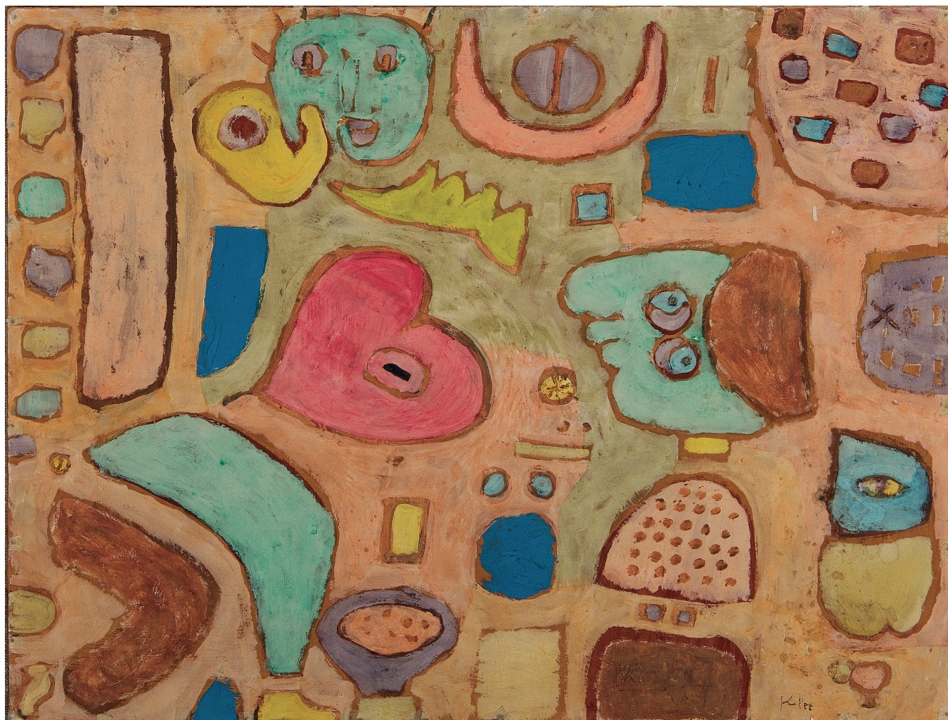
Abb. 1 Paul Klee das kranke Herz , 1939, 382 Kleisterfarbe auf Karton 40,7 x 54 cm Moeller Fine Art, New York