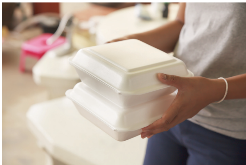
Bioplastique fait à partir de riz