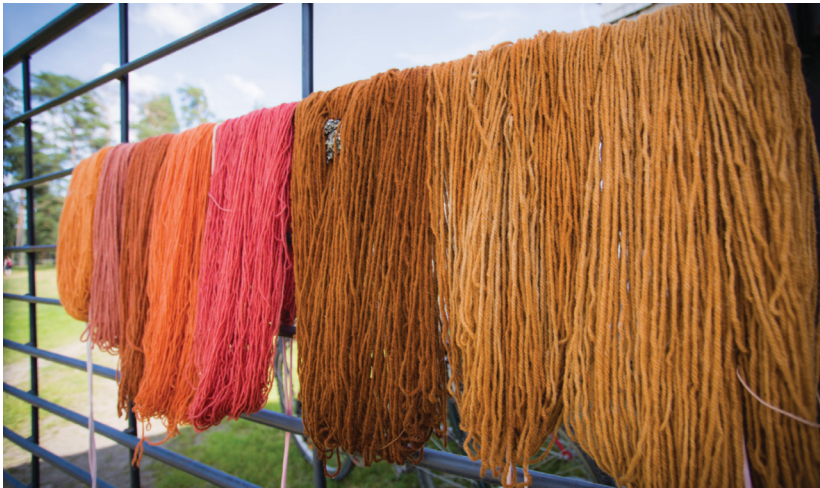
Laine de différentes couleurs Sampo Luukainen

recycler ceux que l'on ne peut éviter sont aussi deux éléments clefs pour construire une économie circulaire. Étant donné que la plupart des produits obtenus des combustibles fossiles peuvent être obtenus à partir de biomasse, ligneuse ou d'autres espèces végétales, les possibilités de l'agroforesterie sont multiples. L'agroforesterie est connue pour la diversification de produits dans la même unité de terre, fournissant une grande variété de matières premières pouvant être transformées.