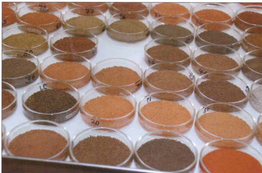
A talajtípusok nagyon változatosak Kenyában

Afrika lakossága rohamosan növekszik, így a következő évtizedekben át kell alakítani az afrikai agráriumot. Ezzel a kérdéssel az Örökzöld Agrárium, Konzerváció, Agrár és Természetvédelmi Osztály foglalkozik. Szükség van a termesztési technológiák korszerűsítésére (tápanyag-utánpótlás, növényvédelem, metszés, öntözés), illetve a folyamatos és a köztes termesztésre a hektáronkénti termésmennyiség növelése érdekében. Sajnos a fekete kontinensen is megfigyelhető az a tendencia, hogy a gazdálkodók átlagéletkora emelkedik, a fiatalok nem kívánják folytatni a tevékenységet, ugyanakkor a termőhelyeket is vesztélyeztetni a lakott területek további terjedése és az elsivatagosodás. Erdészeti,