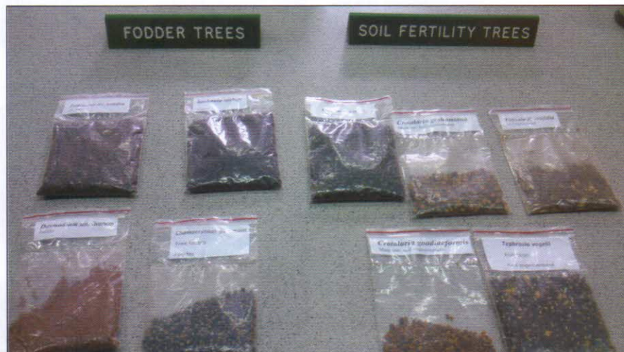
Agroerdészeti szempontból ígéretes fajok szaporítóanyagai

Kenya vízraktározó kapacitása (víz-visszatartása) rettenetesen alacsony mértékű. Az 1969-es 11m 3 -tól 2002-re 4m 3 -re esett vissza a fejenként rendelkezésre álló víz mennyisége. A víz-visszatartásra és a növények öntözésére jelenleg különböző módszereket alkalmaznak. A legfontosabb és legelterjedtebb gyakorlatok a következők: a tetőkről összefolyó víz gyűjtése vasbetontartályokba, mesterséges vízgyűjtő tavak kialakítása gátak segítségével, a víznek a kívánt helyre vezetése árkokkal, a víz visszatartása kőgátak építésével, nagyméretű, bélelt gödrök ásása (akár 700 m 3 -es vízbefogadó kapacitással).