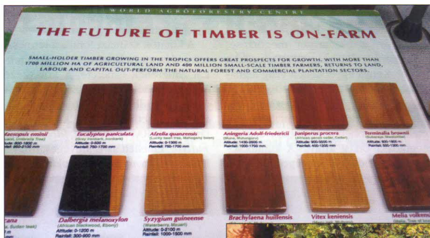
A jövő agroerdészeti fafajái

agroerdészeti szempontból a teljesség igénye nélkül a legfontosabb fajok a következők: Vitex keniensis Turill ('meru tölgy'), Tamarindus indica L. ('madeirai mahagóni'), Melia volkensii Guerke, Podocarpus falcatus (Thunb.) R. Br. ex Mirb. ('simakérgű sárgafa'), Cupressus lusitanica Mill. ('Goai cédrus', 'kenyai ciprus'), Leucaena trichandra (Zucc.) Urban, Gliricidia sepium (Jacq.) Walp., Sesbania sesban (L.) Merr. ('folyami bab', 'egyiptomi csörgőtok'), Eucalyptus camaldulensis Dehnh. (vöröslő eukaliptusz, vörös gumifa), Eucalyptus citriodora Hook. (citromillatú eukaliptusz), Eucalyptus globulus Labill. (golyós eukaliptusz, kék mézgafa).