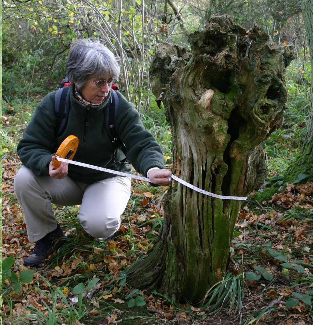
Sub fossil pollard – c 3400 years old