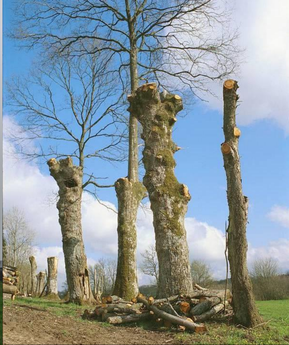
Fossil pollard – c 1500 years old