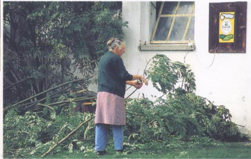
Das Laubabstreifen geschnittener Triebe wird von älteren Leuten durchgeführt.